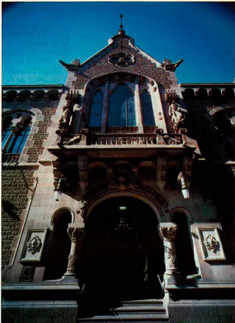
Façana del carrer de Gràcia. Falta perspectiva per a contemplar-la.

menament d'un arquitecte preparat, però sense experiència per a poder formar-se una personalitat excessivament acusada, els directius de la Caixa nomenen un arquitecte que sabrà comprendre i escoltar els propietaris.