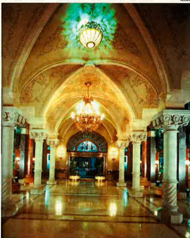
Els interiors dels edificis són enlluernadors.

de Catalunya al segle XIX, és part cabdal d'aquest context històric. És un text de síntesi modèlic, que té interès no sols per a l'habitant de Sabadell.