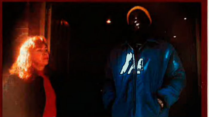
Des de fa uns anys la morfologia del barri Xino ha canviat. Els immigrants africans que es dediquen al proxenetisme i al tràfic d'heroïna, la droga més consumida per les prostitutes de carrer, l'han transformat.