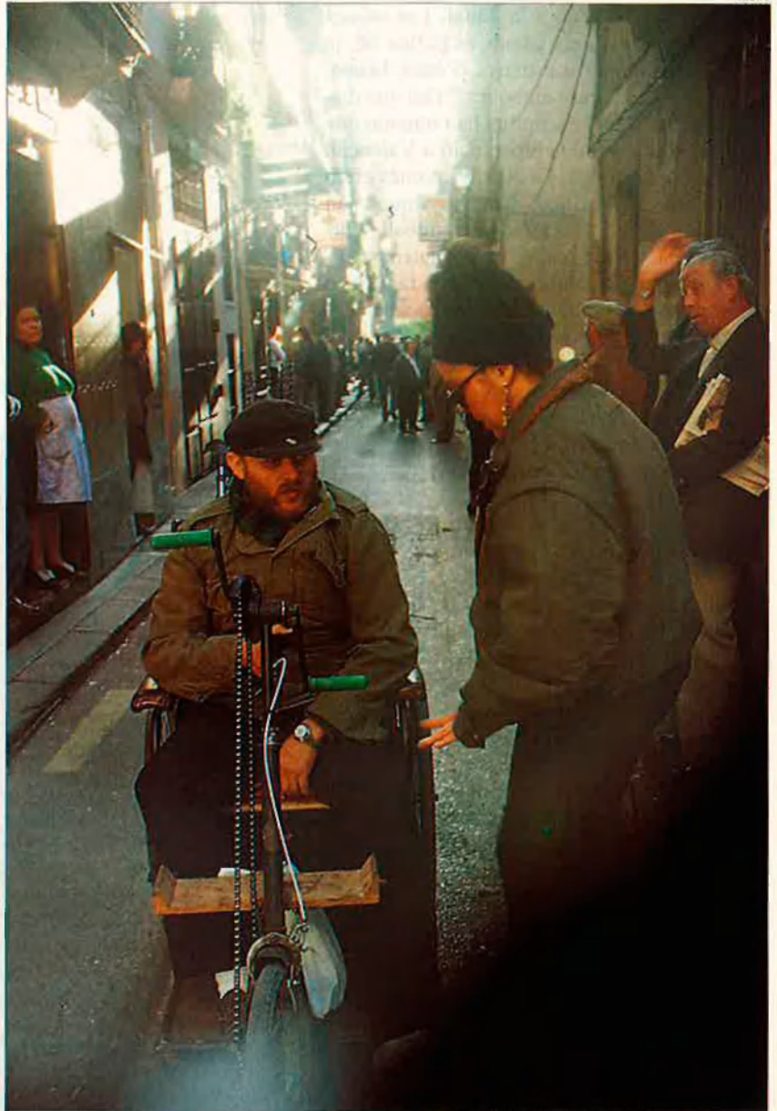
La prostitució en falles es nodreix de clients especialment desemparats. Per a ells, les festes signifiquen poc més que un soroll molest.