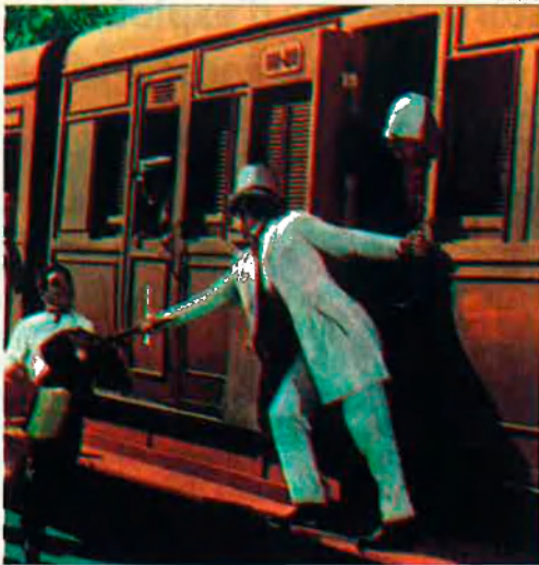
'La volta al món en vuitanta dies'.

Africà ha perdonat Winnie Mandela i la posa al bell mig de la campanya electoral.