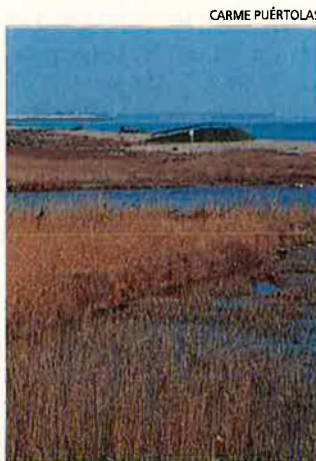
Estany de la Podrida. En els estanys del riu es poden veure més de 300 espècies d'aus migratòries.

complex urbanístic d'oficines i hotels i una tercera pista a 1,5 km de la principal.