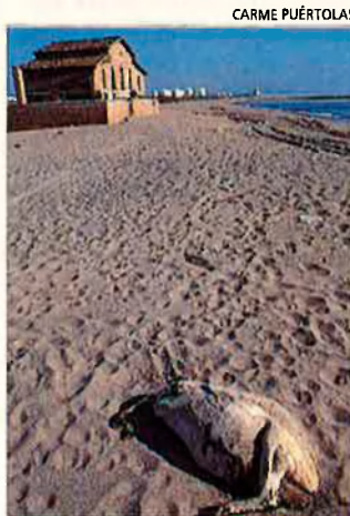
La costa del nord del Llobregat ha patit una gran regressió. Actualment recula sis metres cada any.