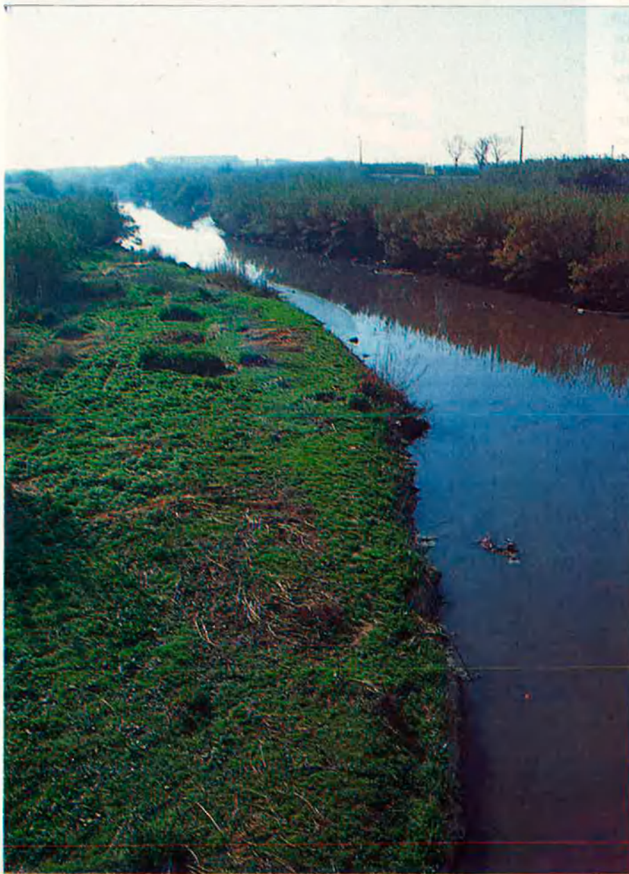
Dalt, el Llobregat des del pont de Mercabarna. A la dreta, Ca l'Arana, aiguamolls per on passarà la nova llera del riu.

E l 9 de març l'Ajuntament del Prat de Llobregat aprovava el conveni per fer un seguit d'infraestructures al Delta del Llobregat. El conseller de Política Territorial, Josep Maria Cullerell, i el ministre d'Obres Públiques, Josep Borrell, s'havien trobat a principi de mes a Barcelona per presentar unes jornades sobre l'impacte econòmic que generarien les infraestructures previstes. Tres mesos abans les negociacions estaven aturades, però, finalment, l'Ajuntament del Prat de Llobregat cedia i ac-