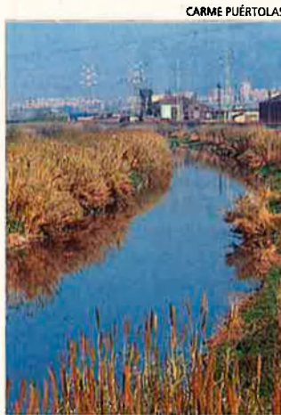
El Llobregat. El seu delta quasi supera en nombre de visitants els aiguamolls de l'Empordà.

Ampliacions discutides. El Port Autònom de Barcelona (PAB) i l'aeroport del Prat veuran ampliada la superfície. Amb el desviament del riu, 2,5 km al sud de la llera actual, el PAB podrà acollir una zona destinada a contenidors i magatzems de mercaderies destinades a tot Europa. L'ampliació de l'aeroport consistiria en un