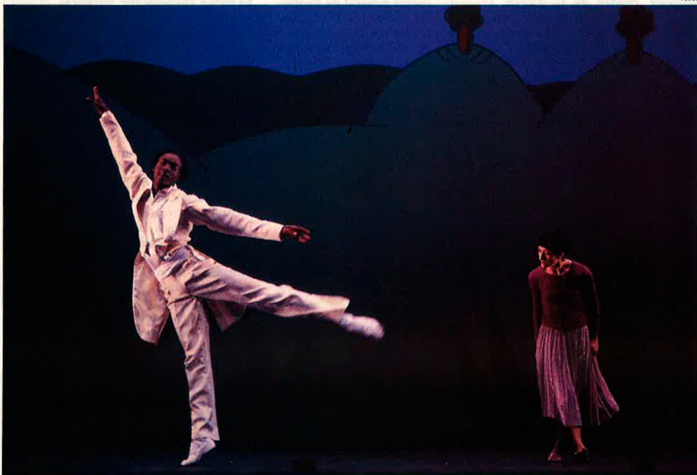
La dansa contemporània. Un art sinuós i difícilment apreciat pel gran públic.