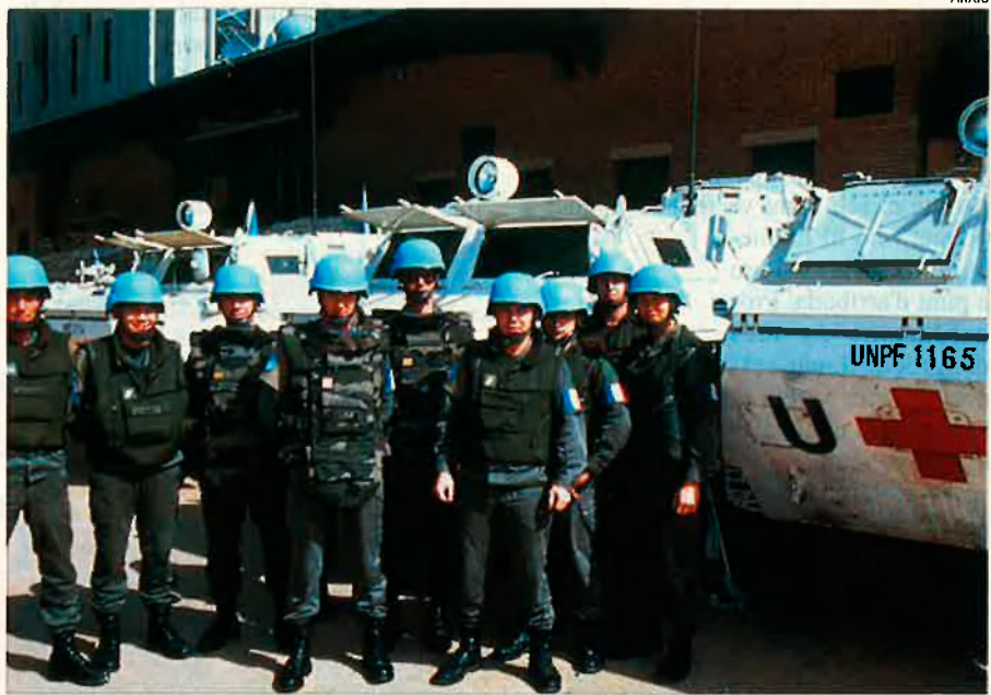
Els Cascos Blaus estan desplegats a Bòsnia. Fins ara, però, el seu paper ha estat molt testimonial.

La tragèdia humana de la guerra local és el pretext per al "gran joc" de les potències. L'últimàtum del 9 de febrer enfrontava l'OTAN amb una de les tres parts, la sèrbia. L'últimàtum eixia d'una iniciativa conjunta dels Estats Units i França. Com que París no donava un