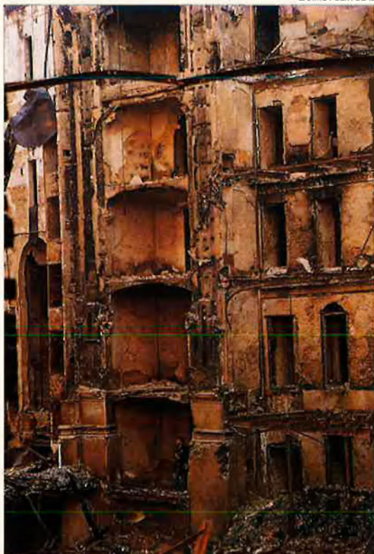
L'interior del teatre, després de l'incendi. Per reconstruir-lo queda un llarg camí legal.

amb els espais adients per a l'ampliació (vegeu veïns ). En segon lloc, arribar a alguna fórmula d'acord amb la societat de propietaris, ja que sembla que, principalment per part del Ministeri de Cultura, no es vol invertir diners si no és un teatre de titularitat pública. En tercer lloc, instrumentar els crèdits necessaris per a poder fer la reconstrucció sense interrupció.