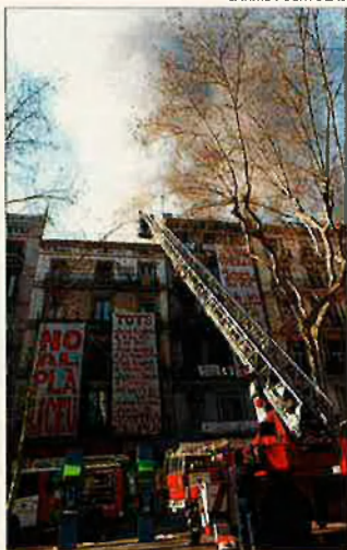
Pancartes dels veïns contra el Pla Liceu. La seva presència entre les flames recordava un afer que s'havia enverinat.