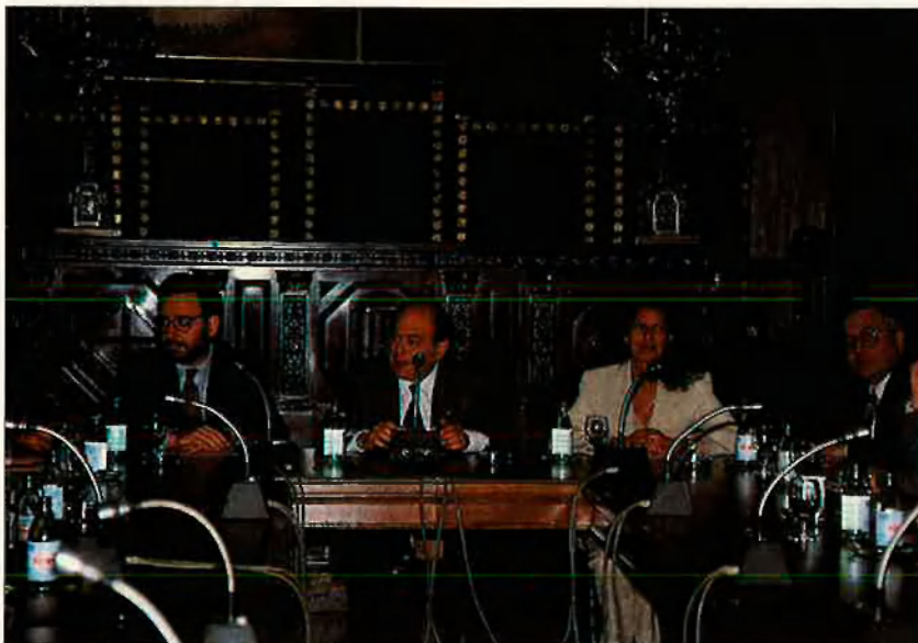
D'esquerra a dreta, Narcís Serra, Jordi Pujol i Carme Alborch. El Ministeri de Cultura i la Generalitat de Catalunya són dos dels cinc socis del Consorci.