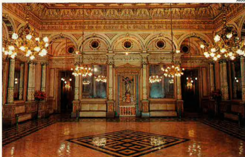
Sala dels Miralls. Aquesta sala ha estat una de les que s'ha salvat del foc.

Seguretat. És evident que el teatre reconstruït en 1861, ho fou molt abans de les actuals normes de seguretat i, per tant, era fora de normes, com quasi tots els teatres antics o edificis històrics (caldria veure si estan dintre les normes, les estretes i llargues fileres de les graderies del Mercat de les Flors). De fet, ha estat 132 anys sense cremar-se. És mala sort que s'hagi incendiat a un any i escaig del co-