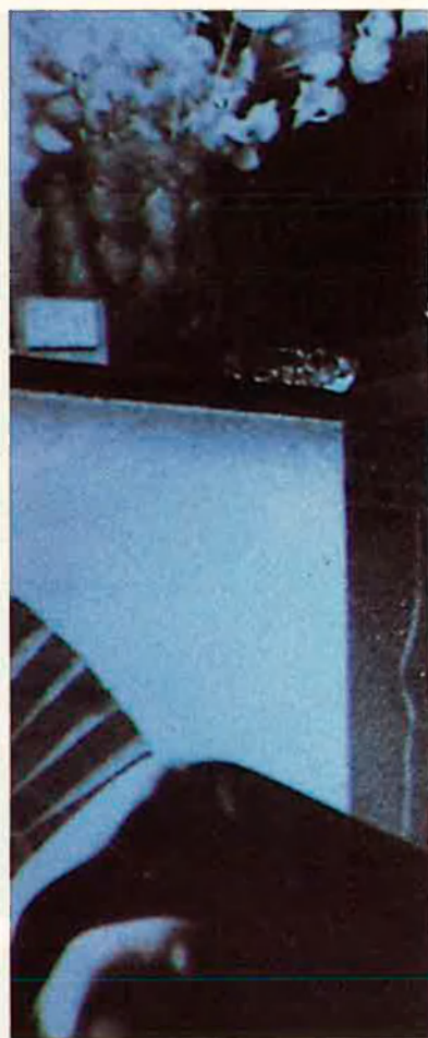
Josep Tarradellas. Els atacs del polític a les activitats d'Òmnium Cultural i els seus dirigents venien del seu convenciment que OC no tenia "una política ferma de restabliment de la Generalitat de Catalunya".