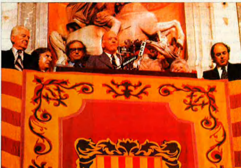
Quan Tarradellas va tornar triomfant a Catalunya, les relacions amb OC es van normalitzar. El president ja no temia els dirigents de l'entitat.

Tot seguit es produeix una pausa, que repre-