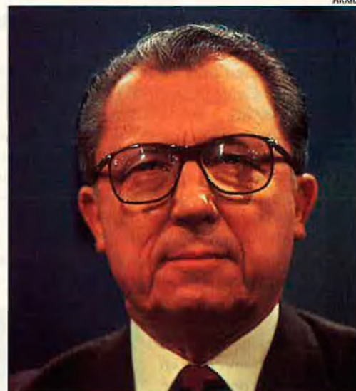
Jacques Delors deixarà el càrrec.