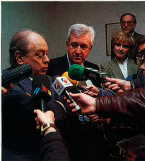
Jordi Pujol i Gabriel Cañellas.

vostè –talment com jo l'he tractat a ell en tot moment– perquè no recordo que anéssim a l'escola plegats. Com diuen a Mallorca: "No sabia que haguéssim jugat junts a bolles". No sé si comprar un contestador nou de trinca a qualsevol lloc que no sigui la Telefónica o resignar-me de forma definitiva al tuteig igualitari cada vegada que vingui un tècnic desconegut. De tota manera, és agradable que molts joves comencin a recuperar el vostè , com si per fi descobrissin que les distàncies formals són una forma de protecció que ens convé a tots.