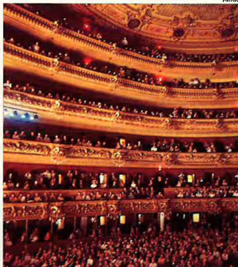
El Liceu, abans de l'incendi.

Jo voldria una reconstrucció pam a pam, centímetre a centímetre, capaç fins i tot de retrobar la vella i coneguda olor del Liceu. En defensa de la tesi tradicionalista, sospito que coincidiria amb la majoria silenciosa, farta de l'absurda modernitat estètica que ens imposa l'autoritat: esculpures horribles, places dures, museus com caixes de sabates, menyspreu al quefer tradicional de l'art català.