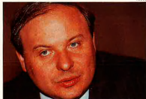
Igor Gaidar. Ieltsin l'ha tret del Govern.

•Txernomirdin té 56 anys. Va ingressar al PCUS el 1961. El 1982 va ser vice-ministre de Gas. Tres anys després va assumir aquest ministeri. El 1986 entrà al comitè central del partit. Des del 92 formava part del Govern rus.