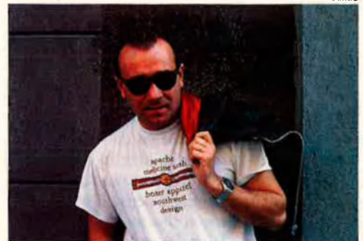
Mikimoto. Tornarà a la tardor.