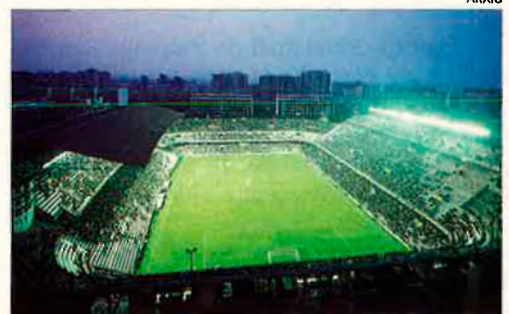
València CF. Farà eleccions el 25 de febrer.