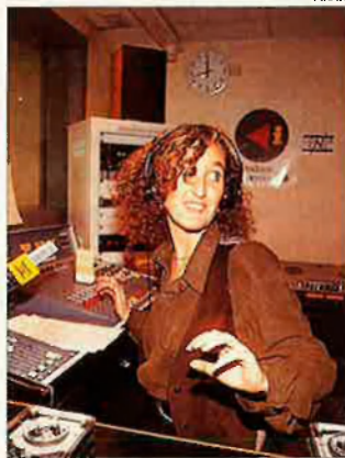
Els periodistes que fan 'Catalunya Informació' utilitzen la tècnica del 'self'. El locutor fa, alhora, d'operador, i sempre sol.

amb flaixos de 30 a 40 segons amb una notícia principal d'un minut, diferenciats de les notícies de Catalunya Ràdio, i una promo —falca indicativa de l'emissora— constant no omplien mitja hora. Calia donar-hi més temps, recuperar notícies d'informatius i, de matinada, repetir formatges . Però l'acumulació de cartutxos , les cassetes amb notícies enregistrades, va forçar la creació d'una nova, i curta, categoria laboral: les llançadores , joves atletes que pujaven i baixaven escales per recollir els cartutxos frescos a temps perquè el locutor self pogués col·locar-los a la cartutxera . Al final, abans de l'inici oficial, es van fer tres dies de simulacions que, al darrer moment, van comptar amb la implicació directa de Lluís Oliva, el director de les emissores de la Generalitat, i hi va col·laborar en la faceta de tècnic Albert Rubio, el cap de programes, que va exercir l'ofici de productor, i Elena Contreras, productora d'informatius, fent-hi tots els papers de l'auca. Entre nervis i defallences, aquell 11 de setembre, un missatge de Jordi Pujol inaugurava una emissora que al cap de pocs mesos ha normalitzat el seu ritme frenètic i ens ha estalviat l'esclavatge dels butlletins horaris.