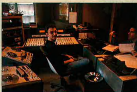
Un dels estudis auxiliars.