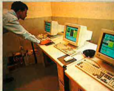
Les emissores de la Generalitat disposen de les més noves tecnologies.