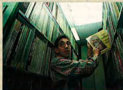
La discoteca conté milers d'àlbums perfectament ordenats.