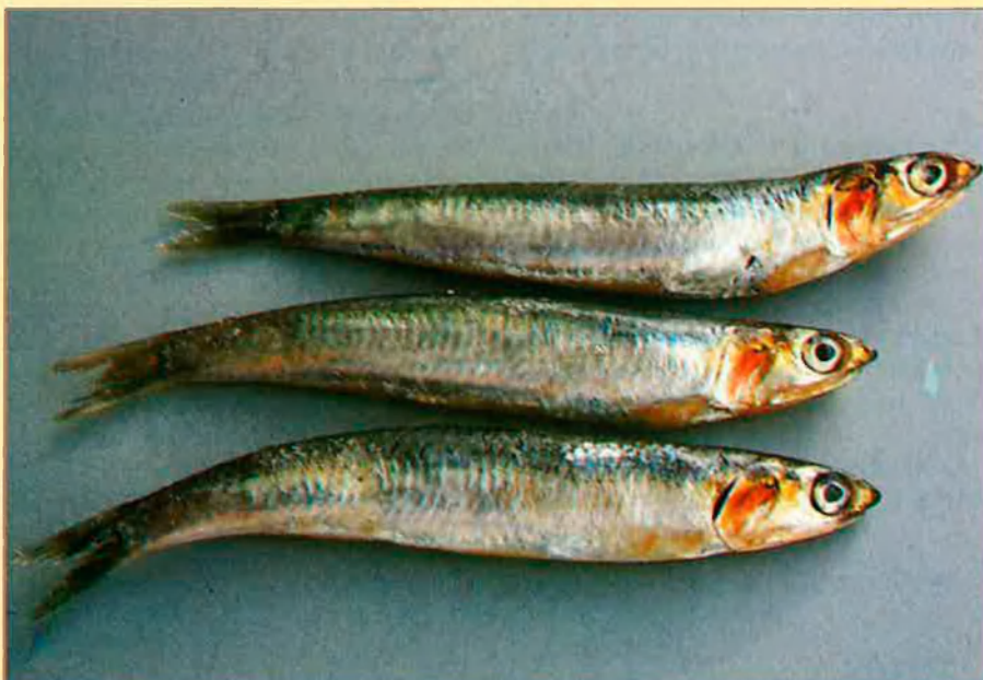
El seitó és molt apreciat pel seu gust fort en qualsevol de les formes en què es menja.

Montsià, Baix Ebre, Baix Camp, Tarragonès, Baix Penedès, Maresme, la Selva, Alt i Baix Empordà, Vallespir, Rosselló, Baix Segura, Baix Maestrat, Baix Vinalopó, Marina septentrional, la Safor, la Plana Alta, l'Horta.