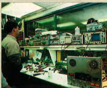
El taller de reparació i manteniment dels aparells electrònics.