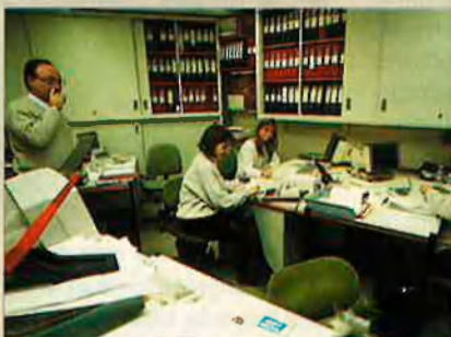
L'administració és un departament bàsic perquè tot funcioni bé.