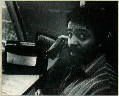
Les transmissions radiofòniques del Barça fetes pel tàndem Puyal-Bassas són les més seguides a Catalunya.