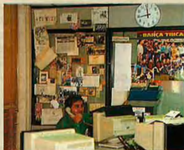
La redacció d'esports, presidida per un pòster significatiu.