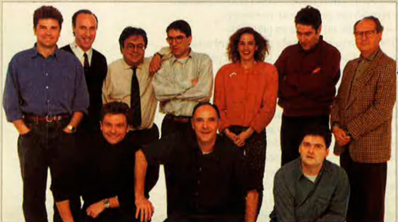
Joan Gràcia, Paco Mir, Joan Barril, Joan Ollé, Paca Fonsalva, Quim Monzó, J. M. Bachs, Carles Sans, Ramon Barnils i Sergi Pàmies formaven la plantilla del programa nocturn 'Bufet Lliure'.