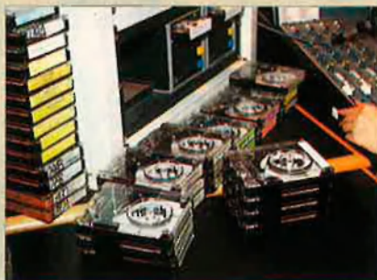
Els "cartutxos" amb les falques, en la taula de control.