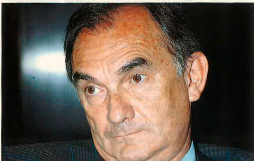
Tomás y Valiente. L'ex-president del Tribunal Constitucional espanyol va parlar a l'Autònoma de "la persistència de la intolerància".