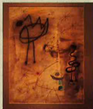
'Personnages, oiseau, étoiles'. 1942.