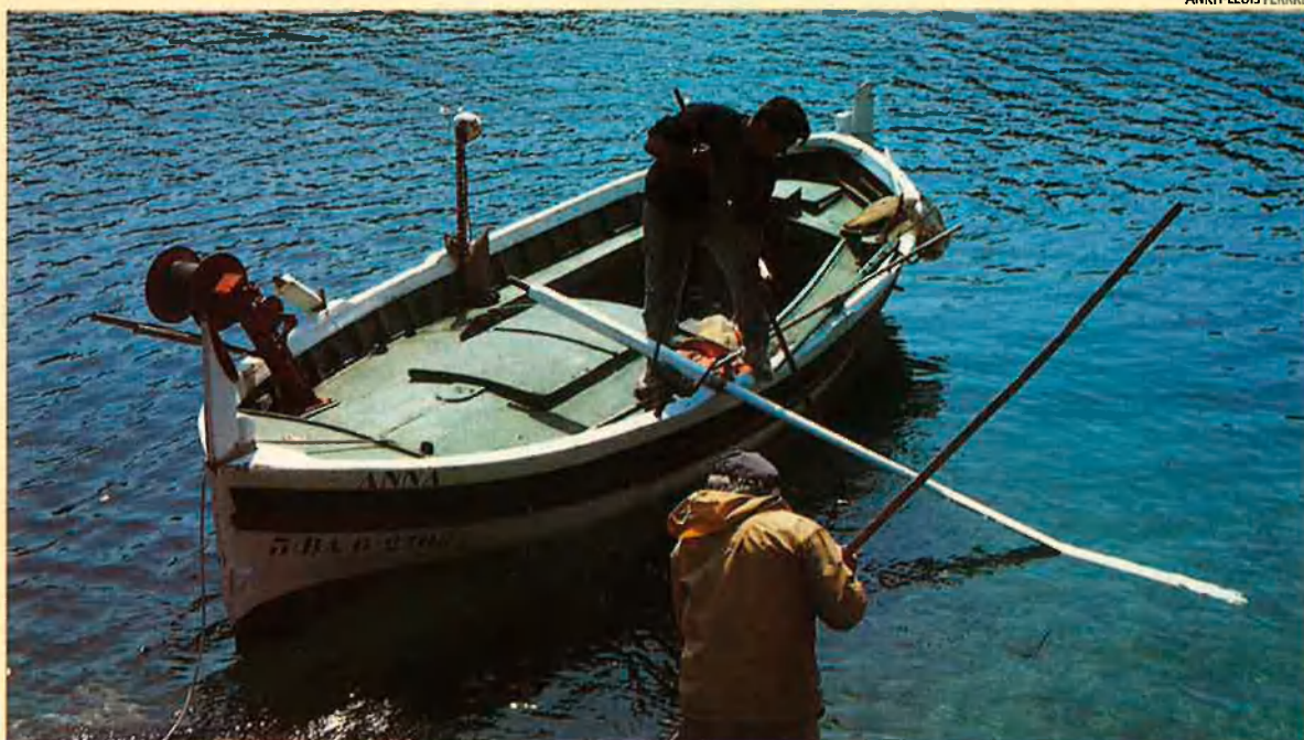
La garota, dita també eriçó, és una espècie de pesca laboriosa.