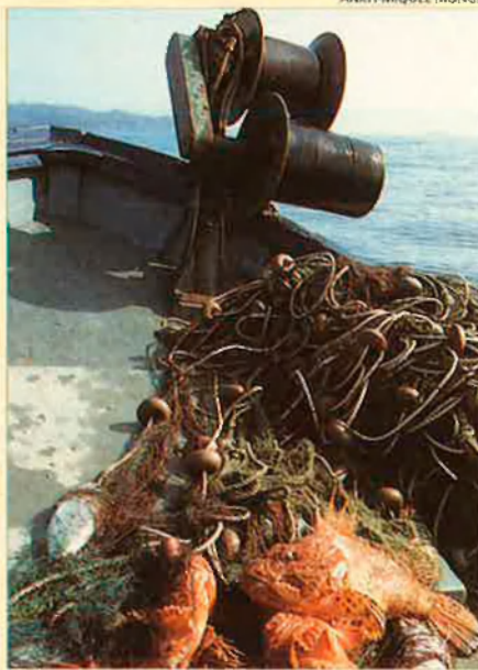
Imatge de la pesca del tresmall.

Però les llagostes no són tan fàcils de pescar. Amagades en racons de les roques, cal enganyar-les amb estris com les nanses. Aquesta mena de gàbia de jonc ha estat pensada perquè peixos i crustacis s'hi fiquin i no en surtin, si no és un cop a la barca o al moll. De nanses, n'hi ha de formes molt diverses i cada una té la seva aplicació particular.