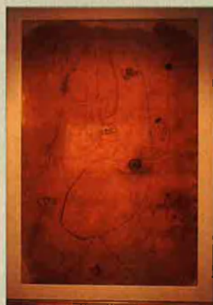
'Femme, oiseau, étoile'. 1942.