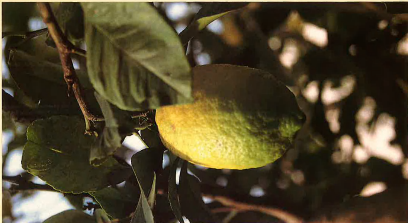
Taronges, mandarines i llimones (foto) són la fruita per excel·lència del nostre hivern.

són: navel, navelina, navel late, valència, verna i fina.