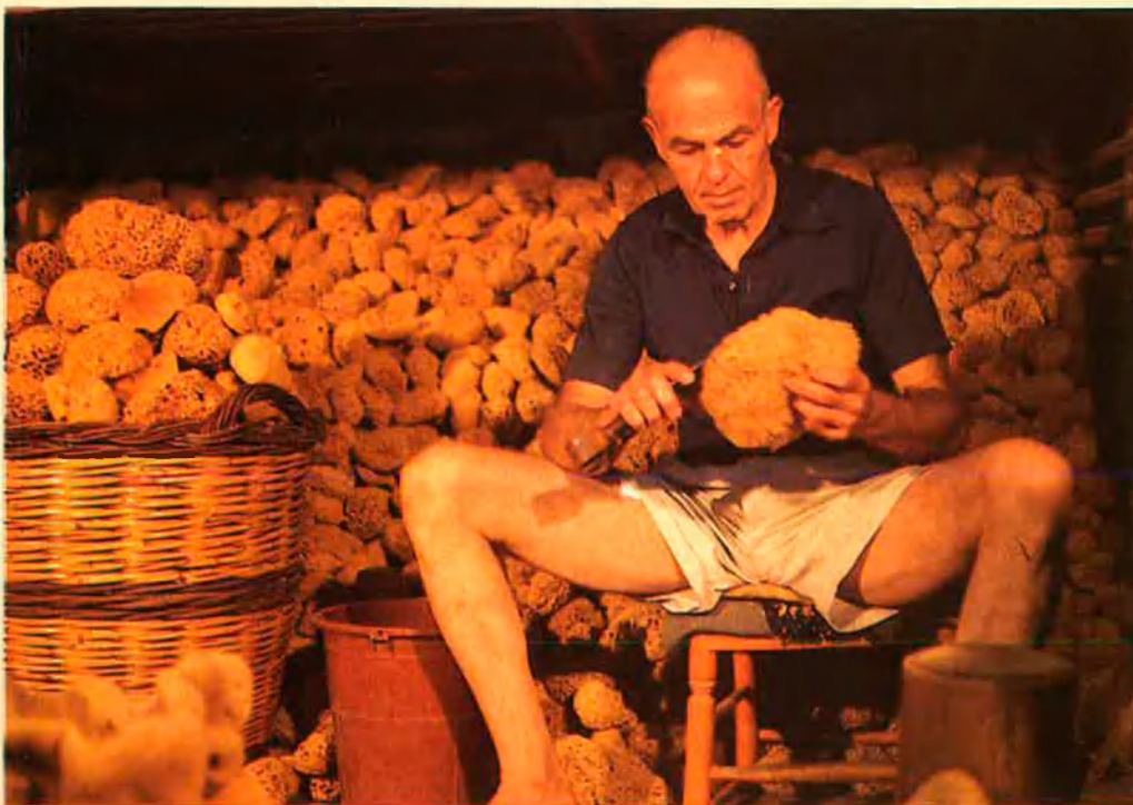
Les esponges naturals formen l'esquelet dels porífers.

Tornem a les llagostes. Pla, com no podia ser d'altra manera, també dóna indicacions categòriques sobre la forma de menjar llagostes. S'han de menjar a la brasa, ens diu. Això ens trasllada a l'essència de la cuina. No és sols que, feta a la brasa, la llagosta té el millor sabor, sinó que, a més, aquesta forma de preparar-la ens porta als orígens: “Els aliments a la brasa, la llagosta a la brasa, ens desplacen a la cuina antiga, a la cuina directa i natural, que en definitiva és la que ens produeix més impressió a nosaltres, pobra gent sofisticada”. Fixem-nos en aquest darrer judici. Pla ens explica que hem arribat a un grau tal de sofisticació que l'única cosa que ens pot sorprendre és, precisament, l'absència de complicacions.