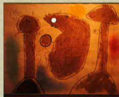
'Personnages, oiseau, étoile'. 1942.