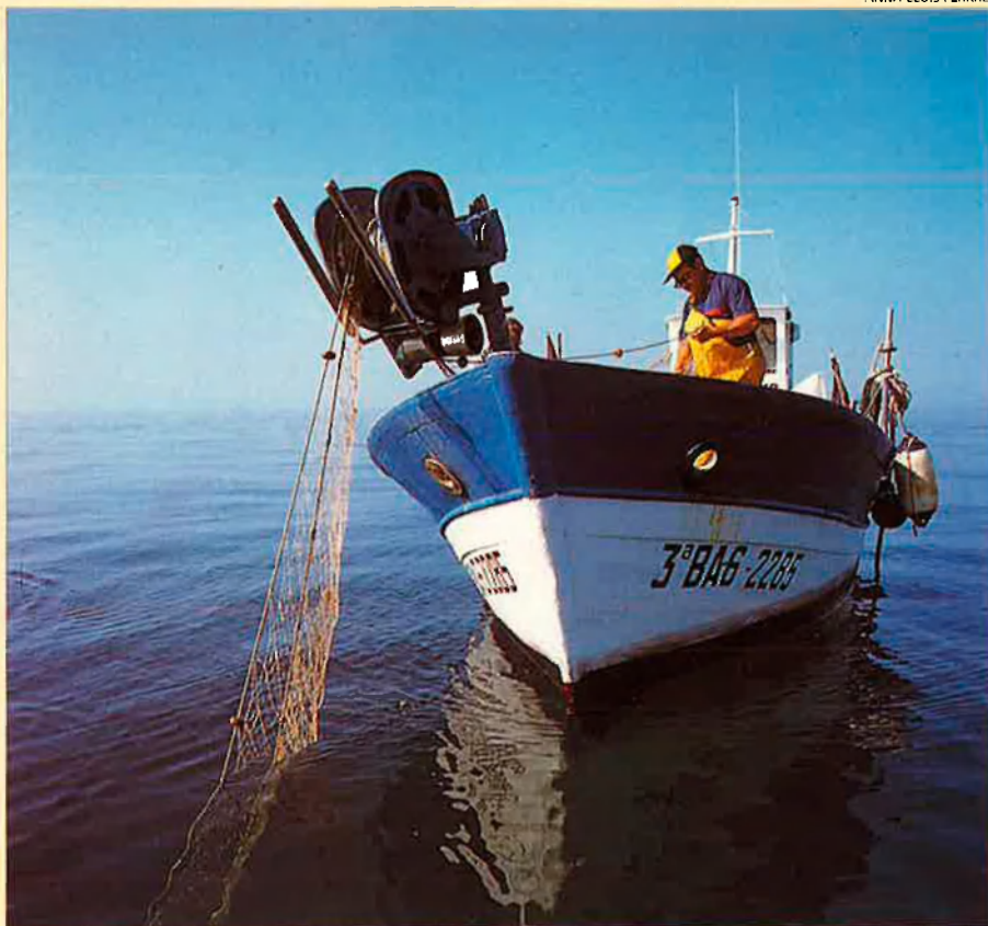
Les barques tresmalleres tenen poc a veure amb els grans vaixells d'arrossegament.

profunditat ens faria errar. Coralls o gorgònies tenen l'aparença de vegetals que cobreixen les roques. Immòbils, bressolats només per les sacades del corrent, tenen tan poca aparença d'animals que fins i tot els naturalistes els varen confondre durant força temps.