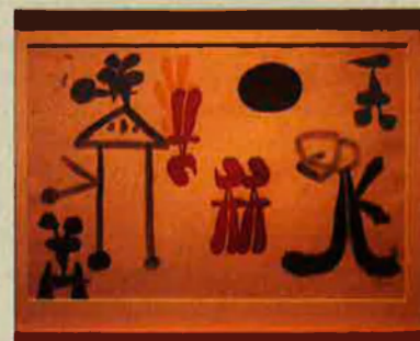
'Sense títol'. 1950.

què la veritat és que no podíem fer el mateix, entre altres coses perquè molts propietaris ja han cedit obres per a altres exposicions. En aquests moments ha acabat l'exposició de Barcelona, amb 280 olis, i al MOMA (Museu d'Art Modern, de Nova York) se n'ha fet una amb 370 obres... És evident que Palma no hi podia competir. Després de parlar-ne molt vaig proposar aquesta idea de 'Miró sobre paper', explica el nét de Joan Miró.