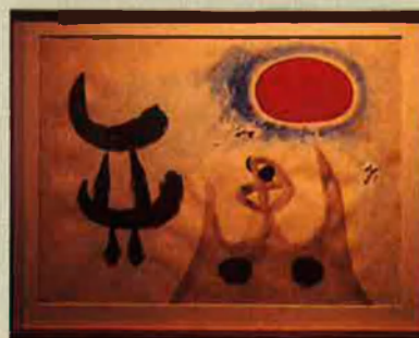
'Sense títol'. 1949.