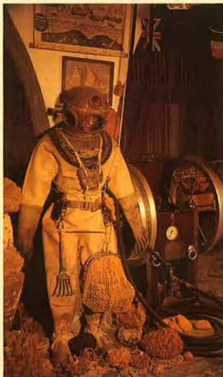
A Kálymnos, molta gent viu de les esponges.

Fuster esmenta una anècdota. Quan es va saber la notícia del llançament del primer Sputnik, un grup d'amics de l'escriptor estava en plena tertúlia sobre aquell avenç tecnològic. Però Fuster portava un tema no menys important: amb unes proves d'empremta a la mà, havia de consultar a l'autor del text si treia una coma o no. L'home es va sorprendre i li va preguntar què era una coma al costat del Sputnik, cosa que no va impedir la insistència de Fuster, perquè el Sputnik canviaria moltes coses, però els problemes més quotidians, des de raspallar-se les dents fins a preparar-se el menjar, passant per posar o treure comes, continuarien essent vitals.