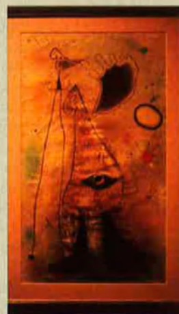
'Personnages devant le soleil'. 1942.