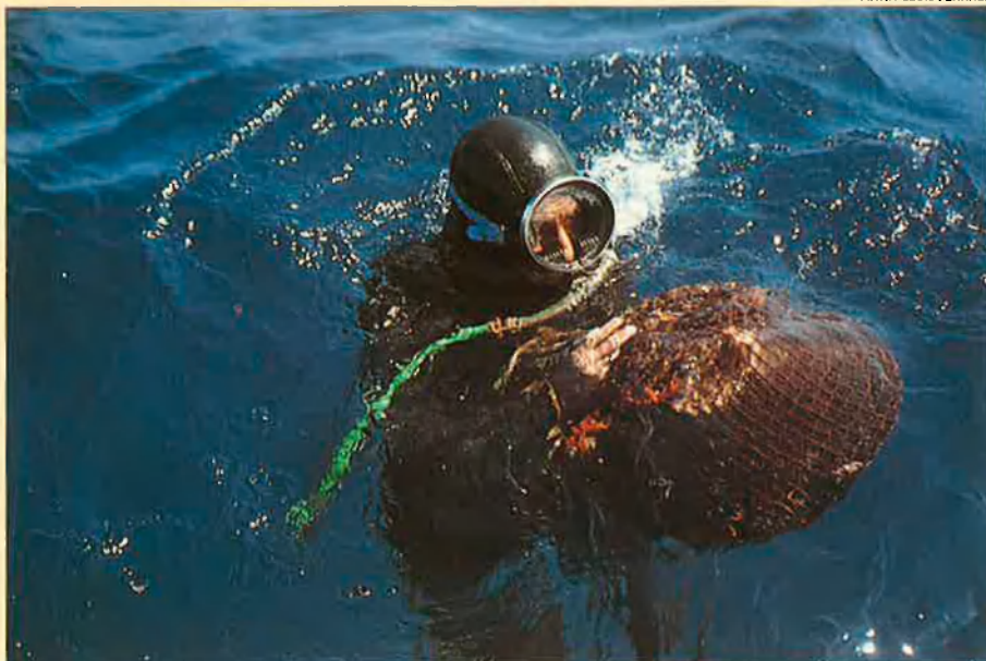
La majoria d'esponges que gastem avui no són naturals.

Pla està contra la llagosta bullida, que no té gaire gust, “però la gent la menja i la paga com si fos de primera qualitat, perquè la qüestió, la gran qüestió, és no menjar peix amb espines, que per tantes persones és obsessionant”.