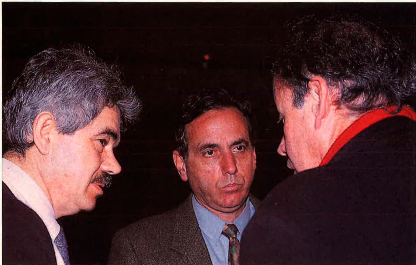
Raimon Obiols i Pasqual Maragall. El primer secretari del PSC i l'alcalde de Barcelona han discrepat sobre el model de direcció del partit, tot i haver acostat posicions.