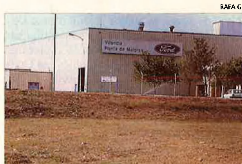
Factoria Ford. Almussafes, també en qüestió.

La factoria que l'empresa d'automòbils Ford té a Almussafes ha registrat pèrdues durant el 1993. La factoria ha tingut números rojos per primera vegada des que va ser inaugurada fa 17 anys, i si s'exceptuen els primers mesos de funcionament. La Ford dona treball a 8.568 treballadors. Durant el 1993 Ford retallà la producció de cotxes i motors, en un 31% i un 19% respectivament, i acomiadà 4.000 treballadors. Ara vol presentar uns plans de regulació que podrien afectar el 80% de la plantilla.