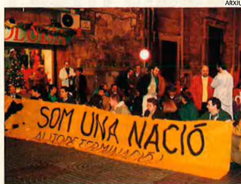
Els nacionalistes de Mallorca sortiren al carrer. A favor de l'autodeterminació.

El dia 31 a l'horabaixa es va fer la tradicional manifestació unitària dels grups nacionalistes. El lema escollit era "Per l'autodeterminació". Aquest lema donava cabuda a grups