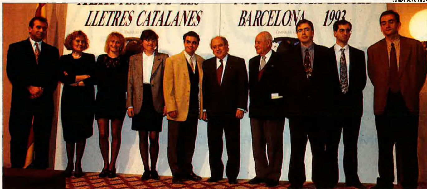
Cloenda de la vetllada. Tots els guanyadors van posar en una foto conjunta amb el president Jordi Pujol.