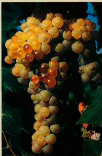
El macabeu. Dóna uns vins d'aroma fina, fruitosa i persistent.