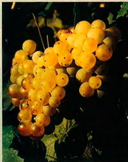
El xarel·lo. Aporta graduació i cos en el coupatge.