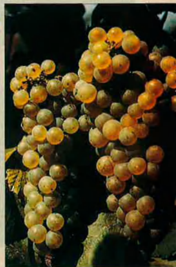
El 'chardonnay'. Cada vegada és més utilitzat pels cavistes catalans.