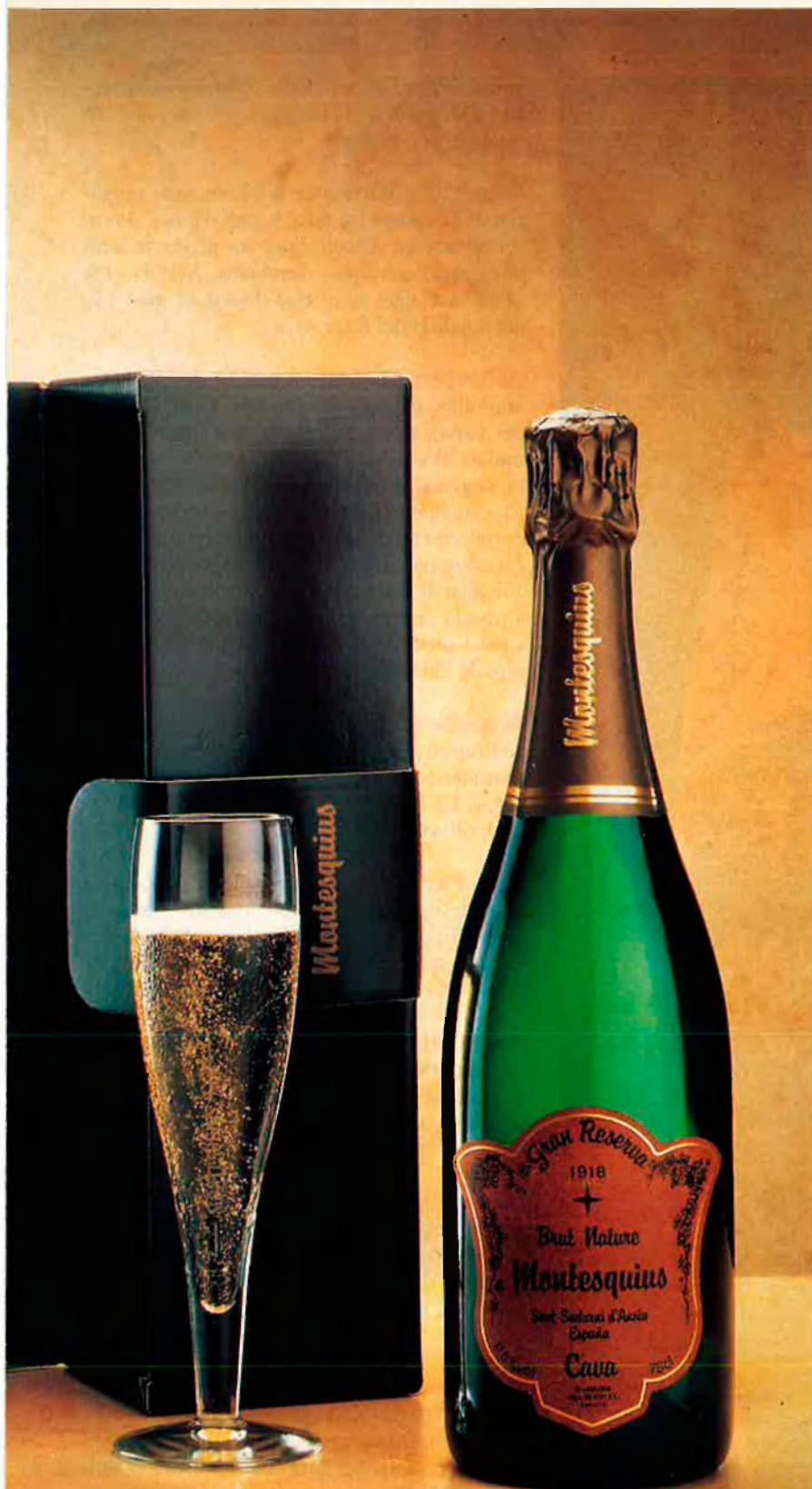
EL SECRET DEL NOU CAVA MONTESQUIUS