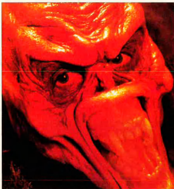
El terror: 'gore'. Barreja d'humor negre i ultraviolència.

El gore que ha influït en tots dos artistes naix com a subgènere a principis dels 60 vinculat al món de Hershell Gordon Lewis, director de cinema especialista en nudies (pel·lícules marginals d'erotisme)