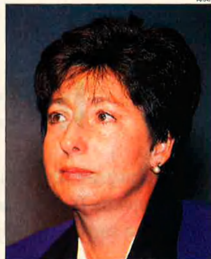
Jordi Pujol podria obrir les seves llistes al Parlament europeu de cara a les eleccions del l'any que ve. Dalt, Rosa Bruguera. Baix, Pere Sampol. El PSM manté relacions fluides amb CiU.

nacionalistes valencians un lloc destacat en la candidatura europea. De totes maneres, la direcció d'UPV manté una absoluta reserva sobre aquesta possibilitat.