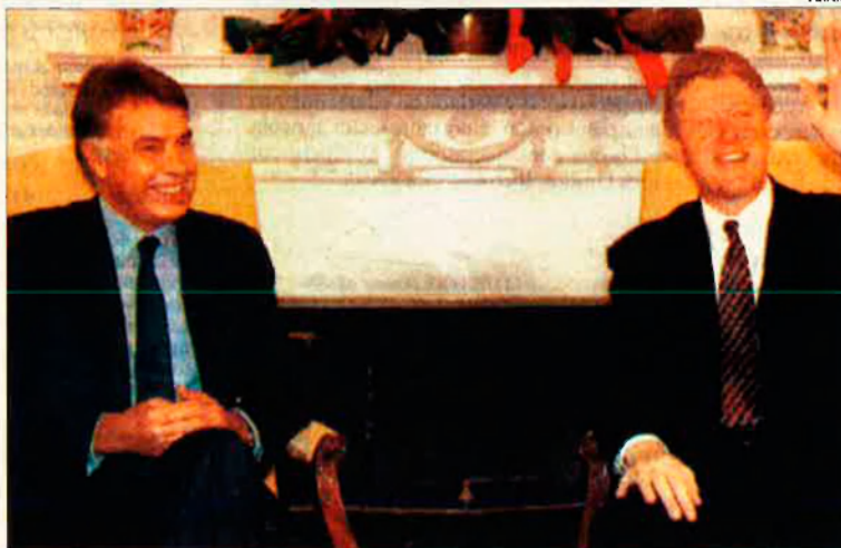
González i Clinton. La trobada finalment ha pogut realitzar-se.

Una munió de diaris nord-americans han dit amb força certesa que Felipe Gon-