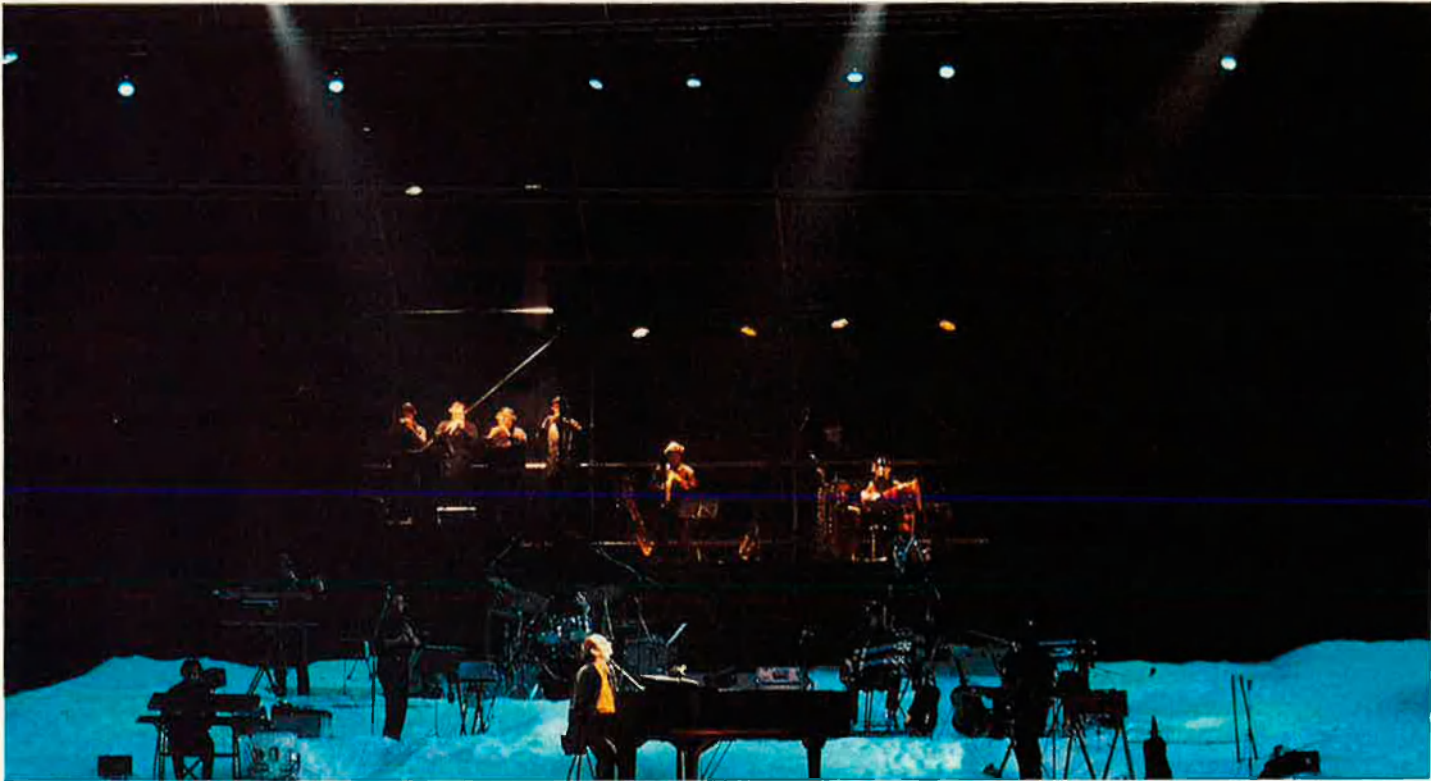
'Un pont de mar blava' és un cant a la confraternització de les cultures de la Mediterrània.