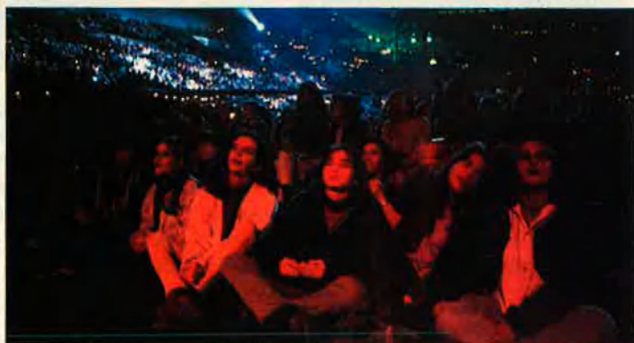
No hi van faltar els símbols de sempre, ni el públic de totes les edats.