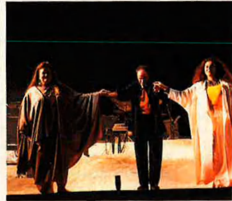
Lluís Llach va emocionar tot el Palau, que respongué amb espelmes i forts aplaudiments a tot l'espectacle.

El Palau Sant Jordi de Barcelona es va omplir els dos dies de concert d'un públic totalment donat. Llach repassà antigues cançons del seu repertori i oferí, amb Un pont de mar blava , un espectacular muntatge musical que fou llargament ovacionat