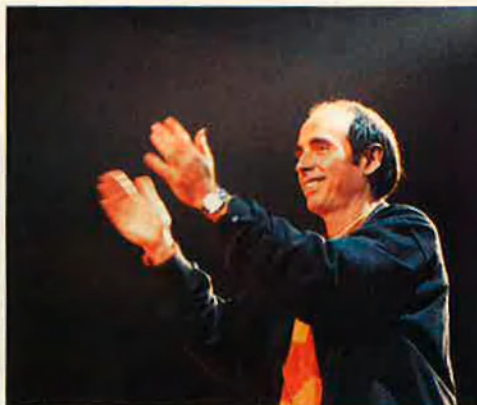
Miquel Martí i Pol ha col·laborat estretament amb Llach en la concepció del disc.

família. Només Rafael Ribó va optar per fer acte de presència pública a la llotja.