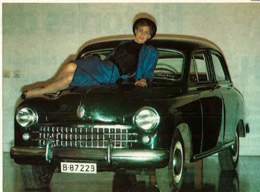
Un Seat 1400, matrícula B-87223. El 13 de novembre de 1953 sortia de fàbrica el primer cotxe.

L'expansió. El 850 era un auto francament lleig, un 600 amb cul, però va tenir molt d'èxit. N'hi havia fins a vuit versions diferents, amb dues portes o amb quatre. Però el model més sensacional era el 850 Sport i que tothom ano-