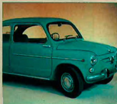
600. Tret al carrer en 1957, aquest model és el més entranyable de la història de Seat.