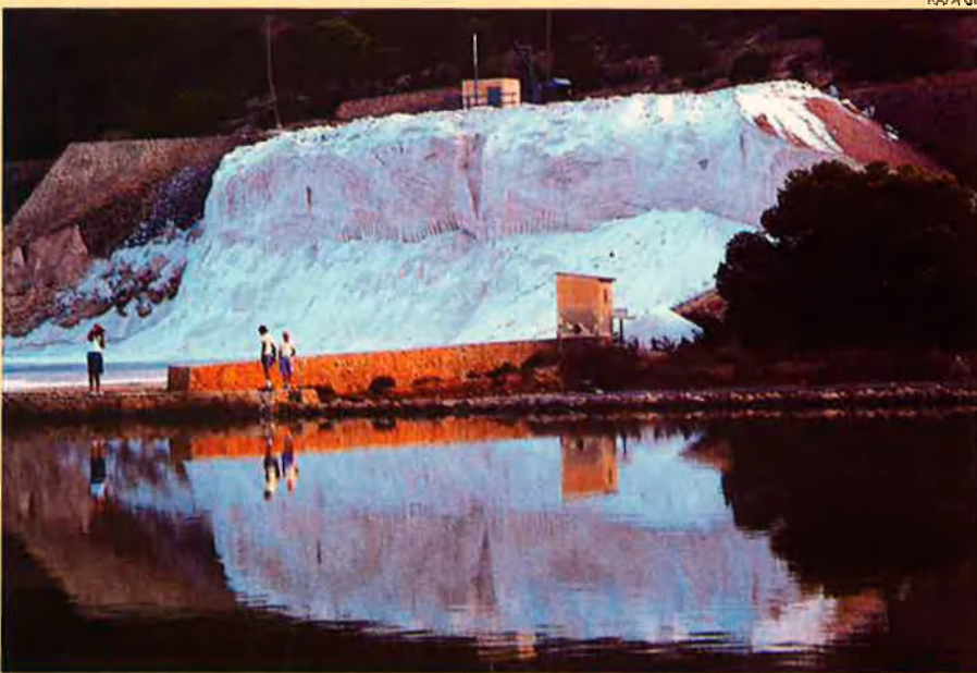
Algunes zones humides ofereixen la possibilitat d'obtenir-ne sal (foto: les salines d'Eivissa).