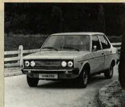
131. Va ser la novetat del 1975, un cotxe de gamma alta i potent que ofería una imatge moderna.