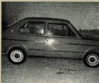
127. Coincidint amb l'èxit d'aquest cotxe, l'empresa arriba als 32.460 treballadors contractats.