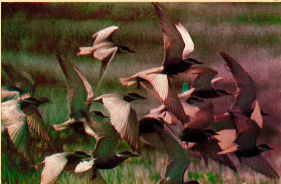
Els aiguamolls són petits paradisos faunístics d'una bellesa impressionant.

Aquesta definició fa que qualsevol riu, estany, embassament, estanyol o aiguamoll pugui ésser considerat mullera. Tot i que la convenció de Ramsar es volia referir sobretot a hàbitats d'ocells aquàtics, les mulleres contenen una gran varietat de formes vives i una complexitat molt atractiva. La Mediterrània té algunes mulleres en perill: el parc Natural de Doñana i les maresmes del Guadalquivir, a Andalusia; el parc de les Tables de Daimiel, a Castella-La Manxa; la Camarga, a la Provença; el golf d'Amvrakikos, a Grècia; i el llac Ichkeul, a Tunísia. Altres àrees, més o menys importants, poden trobar-se degradades i han de ser objecte d'especial atenció.