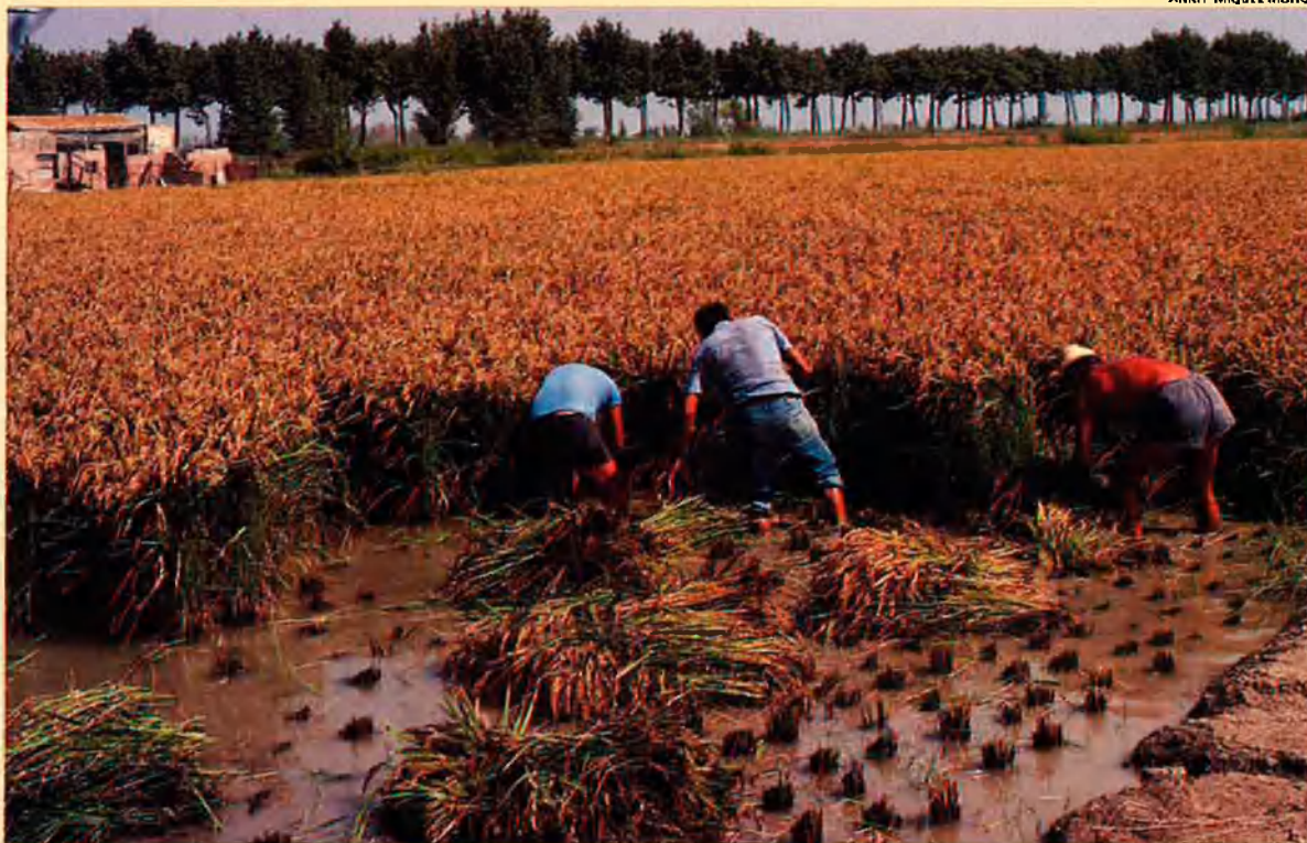
Garbes i rostolls durant la sega manual de l'arròs, que es cull a les acaballes de l'estiu.