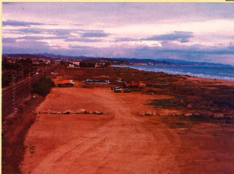
En aquest ras, abans dedicat a l'aparcament, hi ha previst d'instal·lar-hi un punt d'informació.

Actualment, la recuperació està quasi totalment acabada. A la platja, hi han instal·lat unes passeres de fusta per on passen els vianants. S'ha privat l'accés dels vehicles amb la col·locació d'unes tanques. Queden pendents només els passos de vianants i de vehicles que la Renfe ha d'instal·lar a la banda de la sorra que toca a la via. Amb aquestes mesures de limitació de circulació, les dunes es regeneren