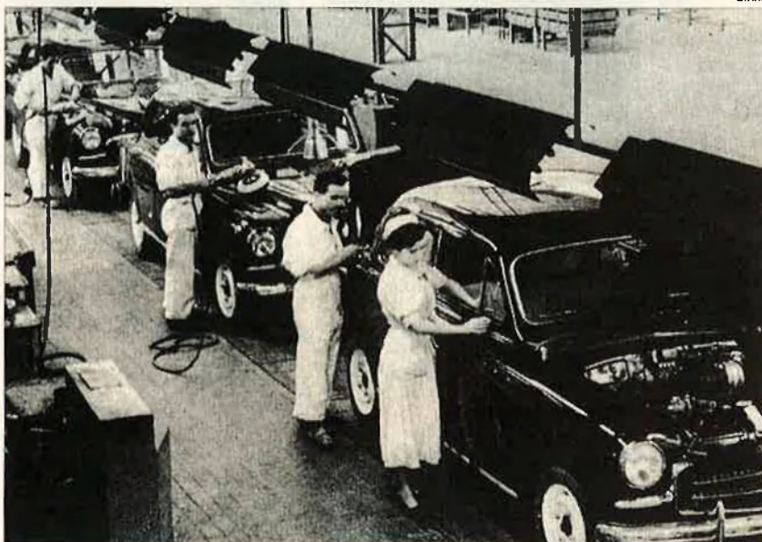
Cadena de muntatge del Seat 1400. La planta de la Zona Franca va començar fabricant aquest model fins l'aparició del 600.

anomenda Asamblea Obrera . Habitualment era un full mida foli escrit en castellà a banda i banda, amb el subtítol "Órgano de los trabajadores de Seat" i el preu de cinc pessetes. Diuen que en els moments de més èxit van arribar a introduir-ne 5.000 a la fàbrica. El primer número va sortir el 2 de gener del 1970; i en van aparèixer 138 fins al setembre del 75. Després, la junta sindical elegida al 1975 va editar una altra publicació, ja legal, que es deia Boletín de la Junta Sindical de Seat . Els primers Asamblea Obrera informaven bàsicament de les reivindicacions per al conveni del 70, entre elles la demanda de 340 pessetes diàries i de les 40 hores setmanals. D'una banda, la publicació era el mitjà d'informació a través del qual els treballadors podien saber el que passava, tant a Seat com a fora. La premsa legal, sotmesa a censura, no ho explicava tot. D'altra banda, tenia una funció agitadora i de propaganda, amb el clàssic llenguatge pamfletari de l'època. En els moments d'enfrontament més directe amb la direcció hi sovintejaven expressions com "¡Seat vencerá! ¡Clase obrera vencerá!". Pel desembre del 1970 informava del consell de