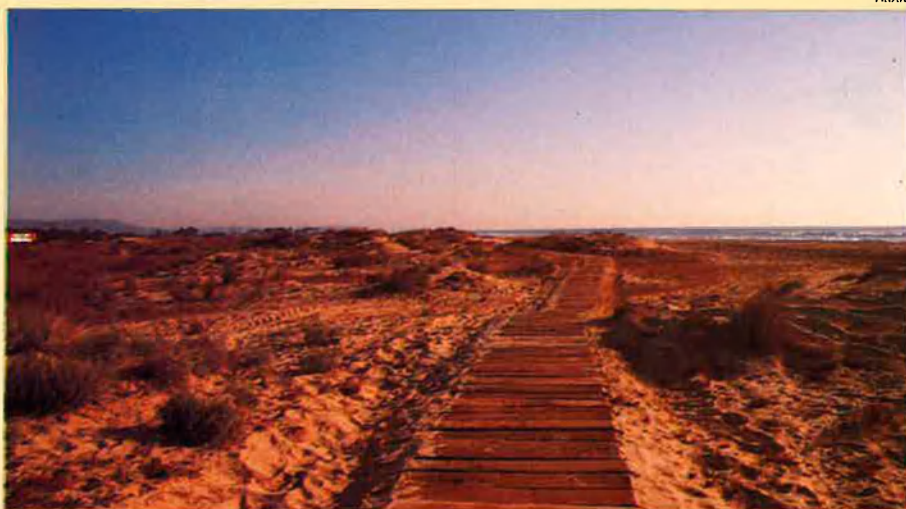
Aquesta és una de les passeres de fusta instal·lades a la platja per reduir els accessos que travessaven les dunes.

A partir de l'any vinent la platja de Torredembarra es convertirà en un exemple de recuperació d'un espai natural degradat. Tot i que aquesta mena d'accions tan específiques no són les que més realitza el Departament de Medi Ambient, hi ha prevista la recuperació d'una riera al municipi de Vespella de Gaià, el terme que al mes d'agost passat va ser destruït gairebé del tot per un incendi. Xènia Bussé