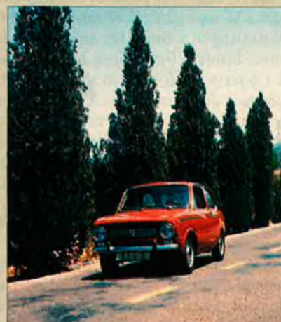
850. Malgrat que era un cotxe molt lleig, una espècie de 600 amb cul, va tenir molt d'èxit.