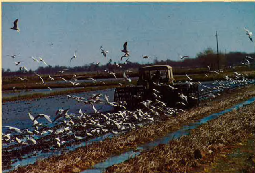
La imatge dels segadors tallant l'espiga ha estat substituïda per la de les màquines.

vença, més en una part de la mediterrània xilena.