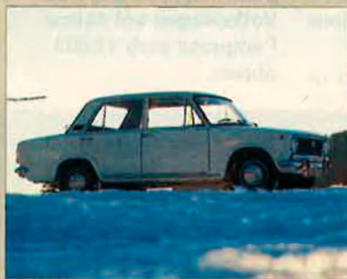
124. Aparegut al maig del 68, en un any se'n fabricaren un milió.