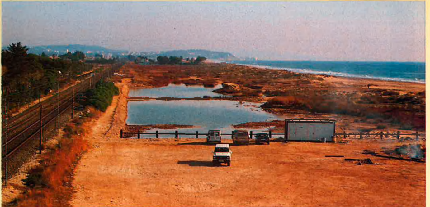
Imatge dels aiguamolls salabrosos de la platja de Torredembarra.