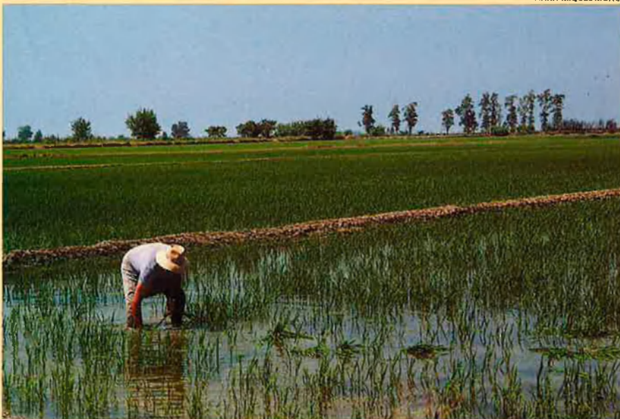
Arrossar acabat de plantar. L'aigua és un component inseparable del conreu de l'arròs.

Sal entre nosaltres. En certes zones humides obtenim un altre producte natural: