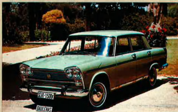
1500. Es va dissenyar i construir pensant en els rics. Era un luxe amb el qual els seus conductors humil·liaven públicament els desgraciats que només podien anar amb 600.