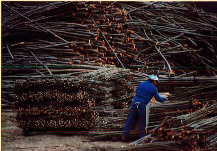
Amb les perxes dels castanyers es fan bótes de vi i altres recipients.

Finalment, la mediterrània australiana no és destaca pels seus boscos. El karri o el jarrah , dos tipus d'eucaliptus, són els únics arbres que poblaven i poblen les zones boscoses de la regió. També hi ha boscos atapeïts i algunes deveses (zones extenses i obertes, que contenen tant zones de conreu, com pastures o arbres ben repatits). Les parts més humides encara tenen una presència important de bosc; però, com que les àrees sense aigua superficial no eren considerades aptes per a l'agricultura, eren reservades per a una explotació intensa del bosc. Abans de la fi del segle XIX, els jarrah de millor qualitat ja havien desaparegut i s'arrossegaven literalment per terra, convertits en llambordes que pavimentaven alguns carrers de Londres.