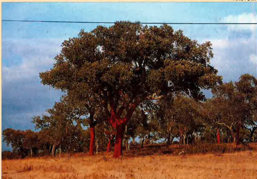
Les alzines sureres es concentren a la conca mediterrània occidental.