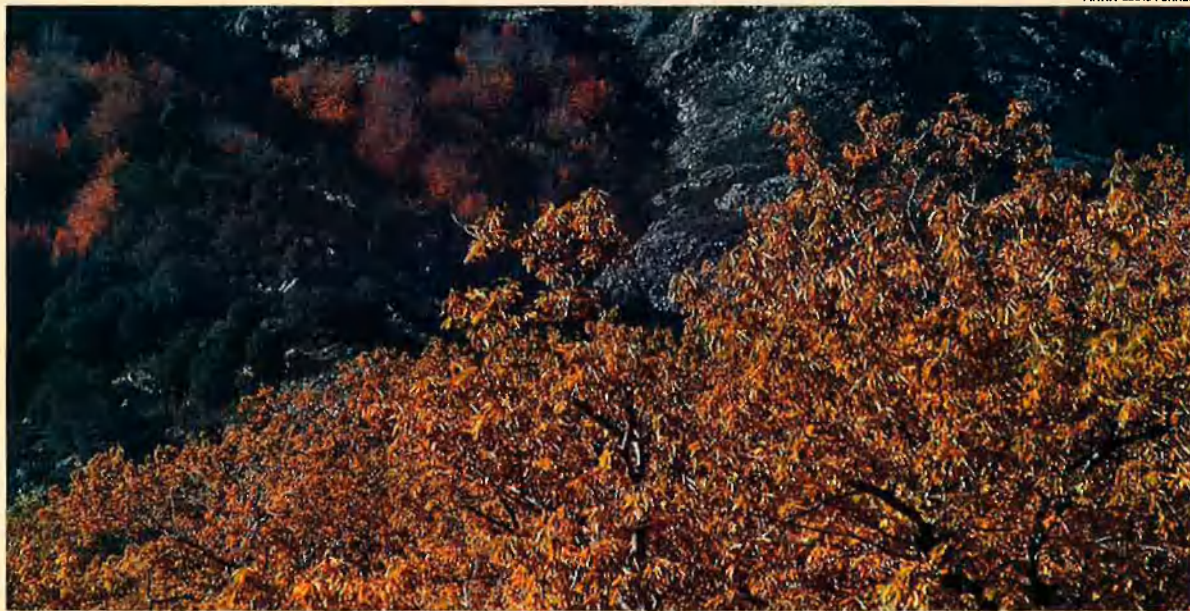
A la tardor, les castanyedes esclaten, les castanyes cauen de l'arbre i la festa de difunts porta aquest fruit a taula.