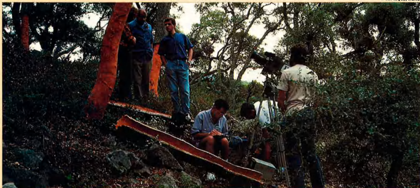
Les sureres s'han convertit en la base d'un florent negoci.

Castanyes i difunts. A la tardor, les castanyedes esclaten, les castanyes cauen de l'arbre i la festa de difunts porta aquest fruit a taula. A primers de novembre, un cop acabades les collites, l'Europa rural honorava els morts. Mentre duraven les feines agrícoles els vius treballaven al camp, i els morts restaven aïllats als espais no conreats. Era la tardor que portava el retrobament. És en terra celta, a Galícia, fora de l'àrea mediterrània, on trobem el simbolisme que uneix morts i castanyes. El dia 1 de novembre a la tarda, els joves anaven als espais sense conreu, torraven castanyes, menjaven i bevien fins que no podien més.