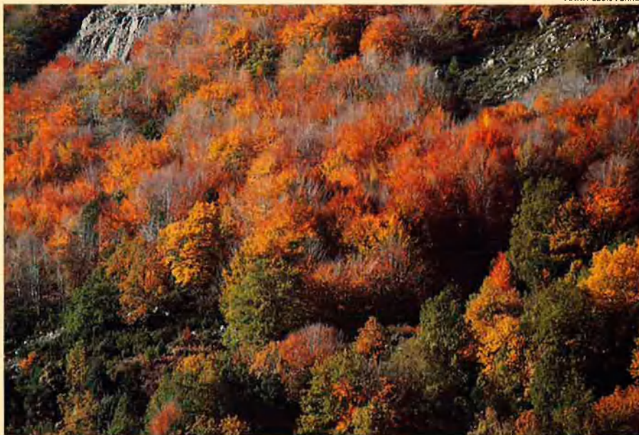
La castanyeda és un altre exemple de la cultura que ha sorgit dels boscos mediterranis.

australiana, amb un sòl més pobre i una densitat de població menor, la destrucció no ha estat tan greu.