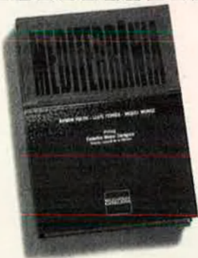
Un recorregut fotogràfic per la Mediterrània.

Amb tot, el gran tema és què passarà políticament, si l'avenç econòmic crea expectatives en favor de sistemes més democràtics i formes de treball més "europeïtzades". Ara el gran valor de l'Àsia són els seus treballadors. O millor dit, la manera com treballen els seus treballadors. Cap protesta. Hores i més hores. Cap garantia. Cap problema. De moment els asiàtics en tenen prou d'adquirir béns. Però aviat hi haurà una classe mitjana important en tots aquests països, marcats per l'autoritarisme. I aleshores què passarà? Els grans empresaris asiàtics diuen que l'enorme creixement actual és precisament la garantia per a poder funcionar després com una economia moderna. Ja ho veurem. Vicent Partal