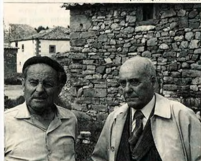
Manent amb un parent, al poble del seu pare, Paredes Güienza (Guadalajara). El poeta va anar-hi el 1980 per bar els familiars que feia anys que no veia.