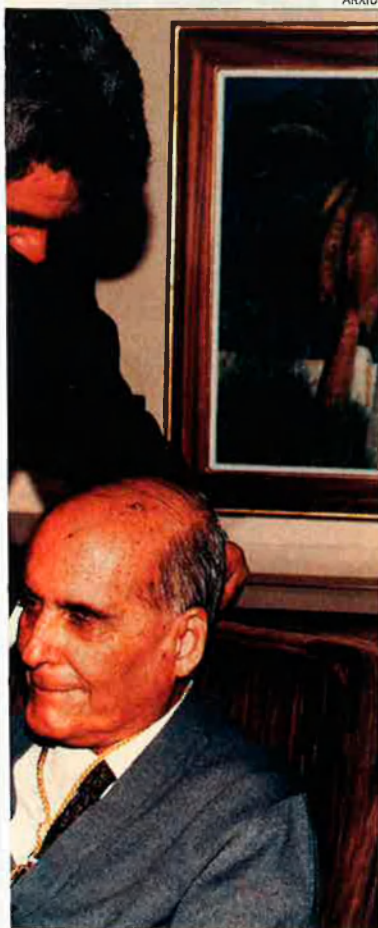
dia sortir de casa. Pasqual Maragall i la Medalla d'Or al Mèrit Artístic.