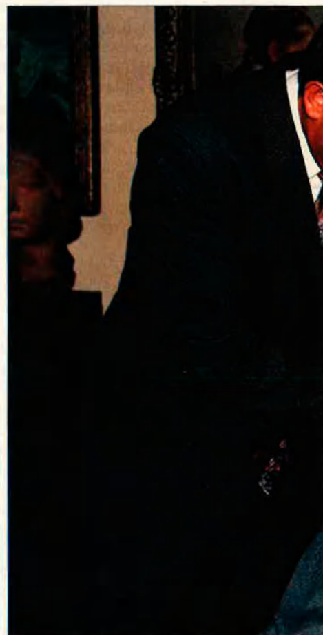
En els últims mesos el seu estat de salut gall, alcalde de Barcelona, va anar-hi per irr