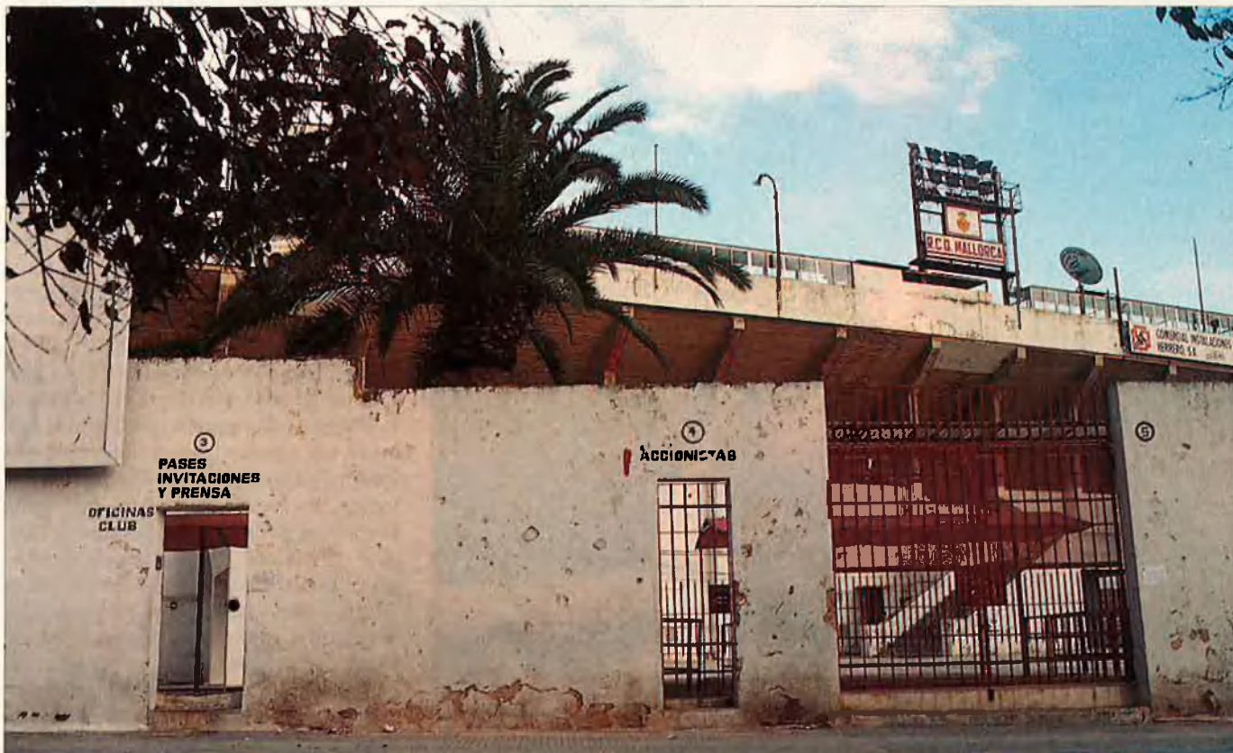
En el Lluís Sitjar, més ciment que mai. L'afluència a l'estadi no supera normalment la dels 4.000 abonats de l'entitat.