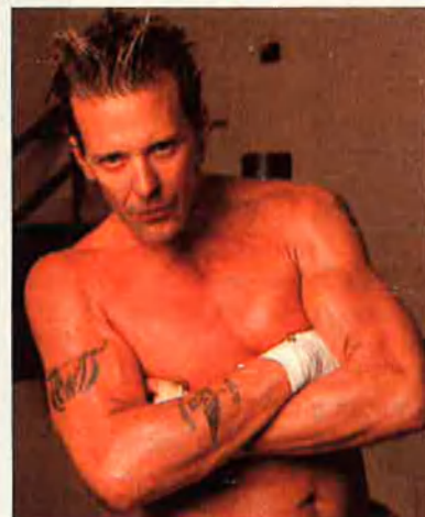
Dalt, Cher. A l'esquerra, Mickey Rourke. La moda del tatuatge s'ha popularitzat en gran part a conseqüència de l'exhibició que n'han fet alguns famosos.