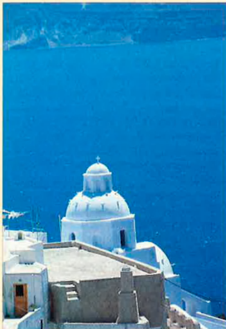
La Mediterrània és bressol de cultures.

La justificació amb què els autors comencen el llibre pot servir també per a la sèrie de televisió: "És el fruit d'un amor apassionat". Un amor amarat d'una aigua lluminosa, agombolat per pinedes silents i sadollat amb els sabors i aromes diversos de vinyes i oliveres, de boscos d'ametllers i de camps de blat. Un amor emmirallat en un mar, però reflectit també en les terres que l'envolten. Un amor que, a salts, viatja a milers de quilòmetres, a llocs on les nostres referències culturals poden sonar estranyes, però on la natura parla el mateix llenguatge, bressola amb el mateix clima, ornamenta amb les mateixes flors".