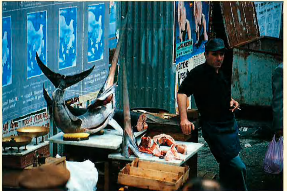
Mediterrània se submergeix en una mar i es passeja per les terres que l'envolten.

Mediterrània , doncs, partia d'una proposta feta al 1985, era concebuda durant el 1986, rodada al 1987, muntada al 1988 i, a la tardor d'aquell mateix any, la començaven a emetre. Després en vingueren cinc emissions més, premis i mencions. La Caixa de Barcelona, avui fusionada amb la de Pensions, va esponsoritzar i coproduir la sèrie i, a més, va voler resumir-la en un llibre: Mediterrània passava del mitjà audiovisual al suport imprès. Se n'editaren