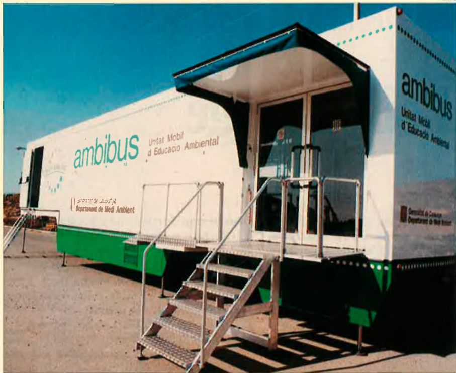
L'ambibus vol conscienciar i informar la població sobre la gestió integrada de residus.

ment de la matèria orgànica dels residus (compostatge).