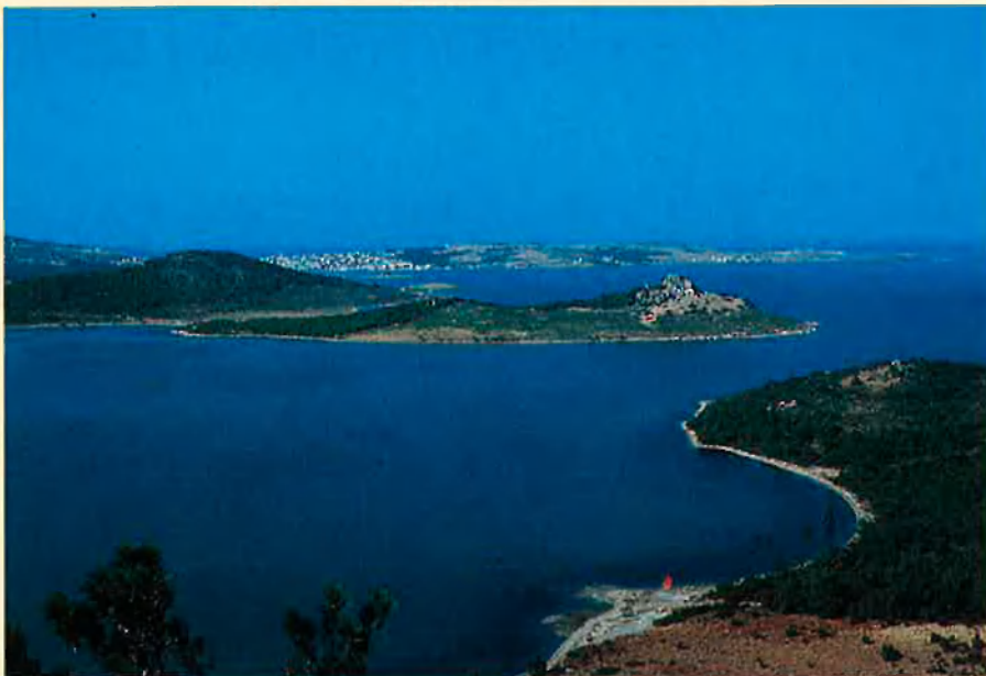
Els paisatges mediterranis són d'una gran singularitat.

Així, en climes constants i adients, de temperatura suau i aigua abundant, les plantes poden tenir fulles perennes relativament grosses o poc enduredes. Si hi ha èpoques de fred accentuat, les plantes solen ser caducifòlies, és a dir, amb