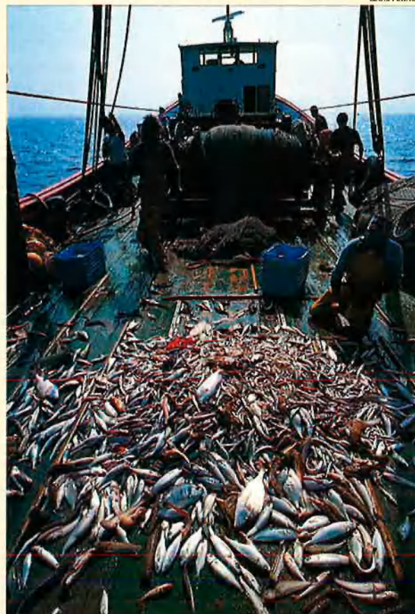
El nostre mar i el seu món captiven tothom.