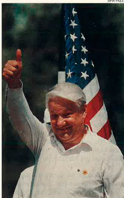
Ieltsin: Un mal menor per Occident.

Tot amb tot, el ieltsinisme en el poder no ha volgut cometre l'error de deixar sense representació electoral els anomenats "rojos i bruns". Un cop aplicada una variant de la "falsificologia" a Baburin, i posats fora de joc els sectors més recalitrants dels nacional-bolxevisme: l'ultracomunista Víktor Anpílov a la presó, els nazis de Barkàixov a la clandestinitat, el Front dissolt, el govern mateix ha decidit on aniran a parar el vots nacional-comunistes: el Partit Comunista de Rússia, que dirigeix Guennadi Ziugànov, i el Partit Agrari