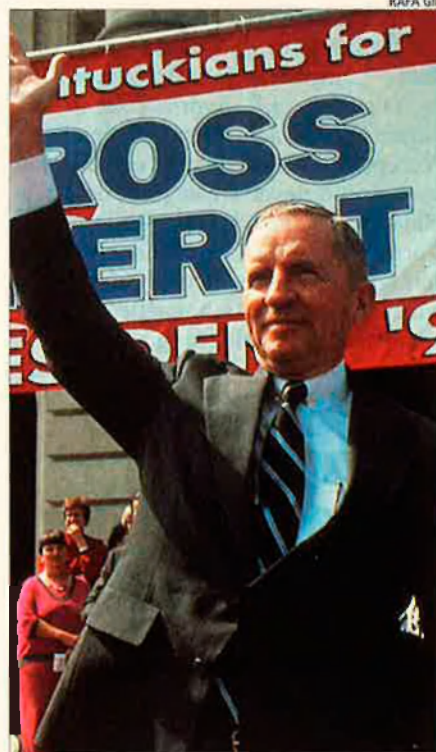
Ross Perot. L'ex-candidat féu demagògia en el debat sobre el NAFTA.

Naturalment, encara manquen moltes de les qüestions de detall que sempre són categories en negociacions com la del NAFTA, però la formulació del tractat sempre ha estat prou flexible i sense aquella transcendència d'objectius cartesians que, per exemple, va fer perillar el tractat de Maastricht. Tot queda