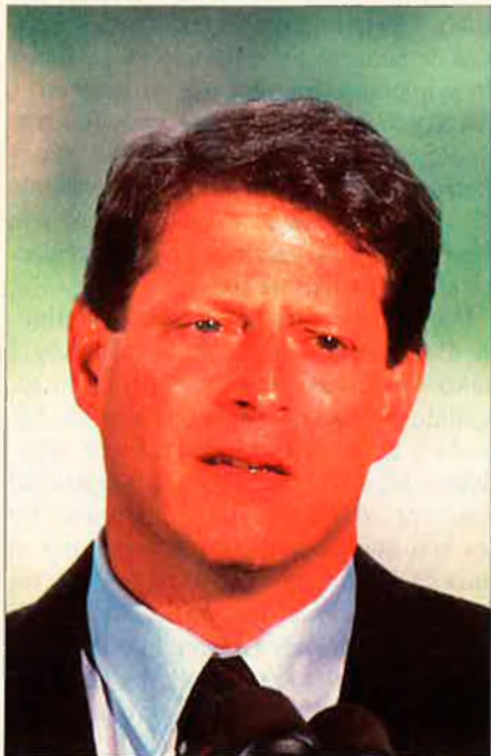
Al Gore. El vice-president refutà Perot.

competitivitat geocomercial com a alternativa als desequilibris bèl·lics. Com una segona empenta, l'endemà de la votació de la Cambra de Representants, anaven arribant a Seattle les quinze delegacions del Fòrum Pacífic-Asiàtic de Cooperació Econòmica, amb papers ben favorables al GATT a la maleta, en contrast amb una Europa comunitària que no sap si gosar fer una petita guerra comercial als Estats Units. La regió representada pel Fòrum té, a hores d'ara, la meitat de la producció mundial i un 40% del comerç. Vet aquí com revé la idea d'una "Comunitat Pacífica" recuperada per Bill Clinton, disposada a eliminar obstacles comercials i a integrar –com sembla que succeirà a Seattle– països com ara Mèxic i fins i tot, potser, Xile.