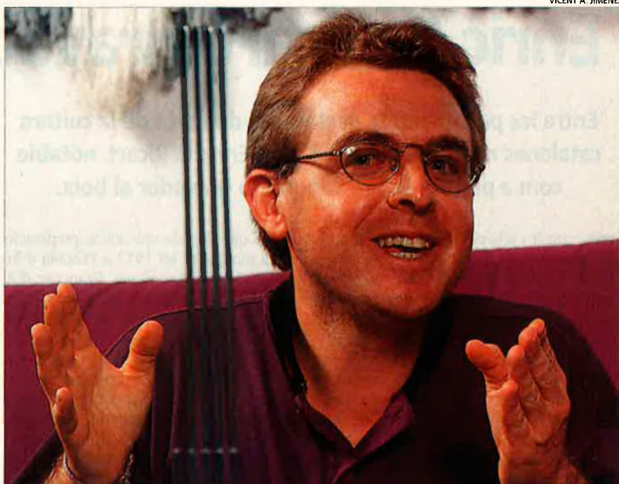
"La poesia ha de ser compromesa."

—Transcendeix el camp poètic. S'intenta adobar tot d'una normalitat extrema, com si a partir de l'any 1975 en aquest país tot fóra normal, i això és mentida. Passen coses tan o més greus que abans del 75. Jo m'he educat en la democràcia, però no crec que tot siga "normal". La poesia també paga aques-