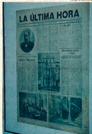
Portades de Palma Post i Última Hora. L'exposició recull totes les publicacions.

re el fundador del diari, Josep Tous i Ferrer. L'altre vídeo desenrotlla una jornada completa del diari a l'actualitat.