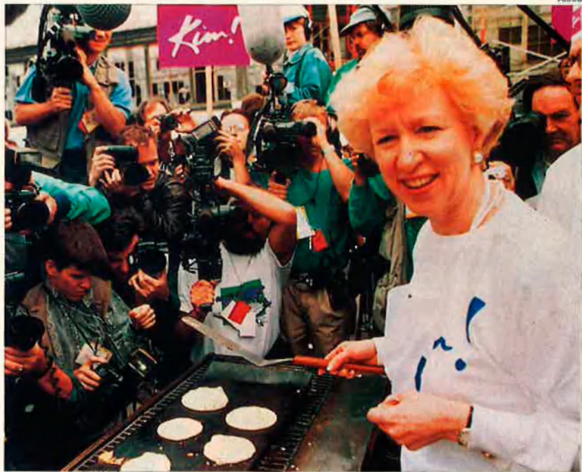
Kim Campbell. L'ex-primeira ministra canadenca ha sofert una humiliant derrota, ja que els conservadors que ella encapçala han passat de tenir 170 escons a només tenir-ne dos.

Quant als liberals, dirigits per Jean Chrétien, el seu triomf, malgrat que ha estat per majoria absoluta –en contra de les previsions inicials–, no esborra les profundes diferències provincials i regionals que divideixen el país. En primer lloc, el fet que el gruix dels seus diputats provenen d'Ontario (on han aconseguit tots els escons –98– menys un dels que hi havia en joc) i de les províncies atlàntiques (30 de 32) fa que el