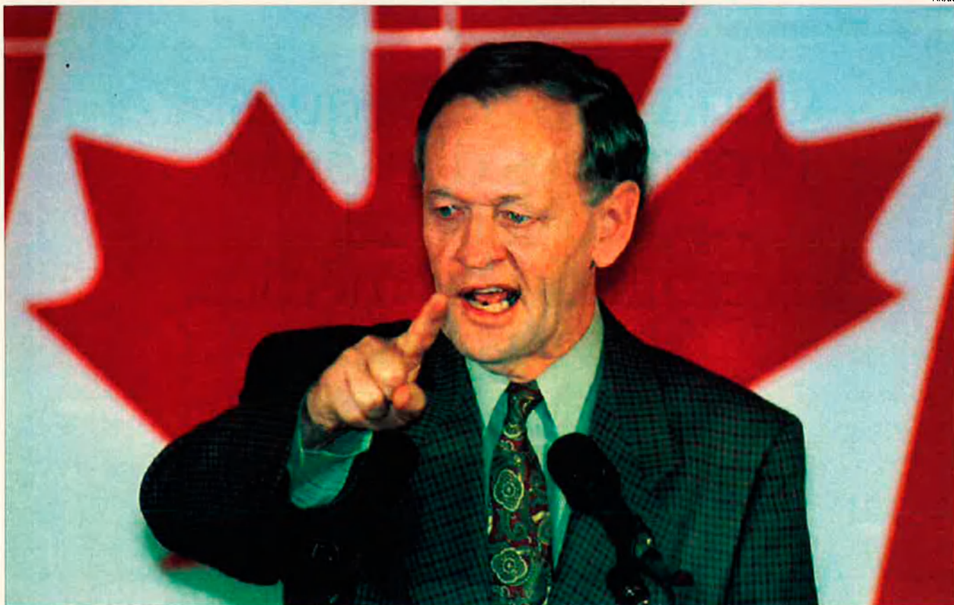
Jean Chrétien. El seu Partit Liberal ha estat el gran triomfador dels passats comicis al Canadà.