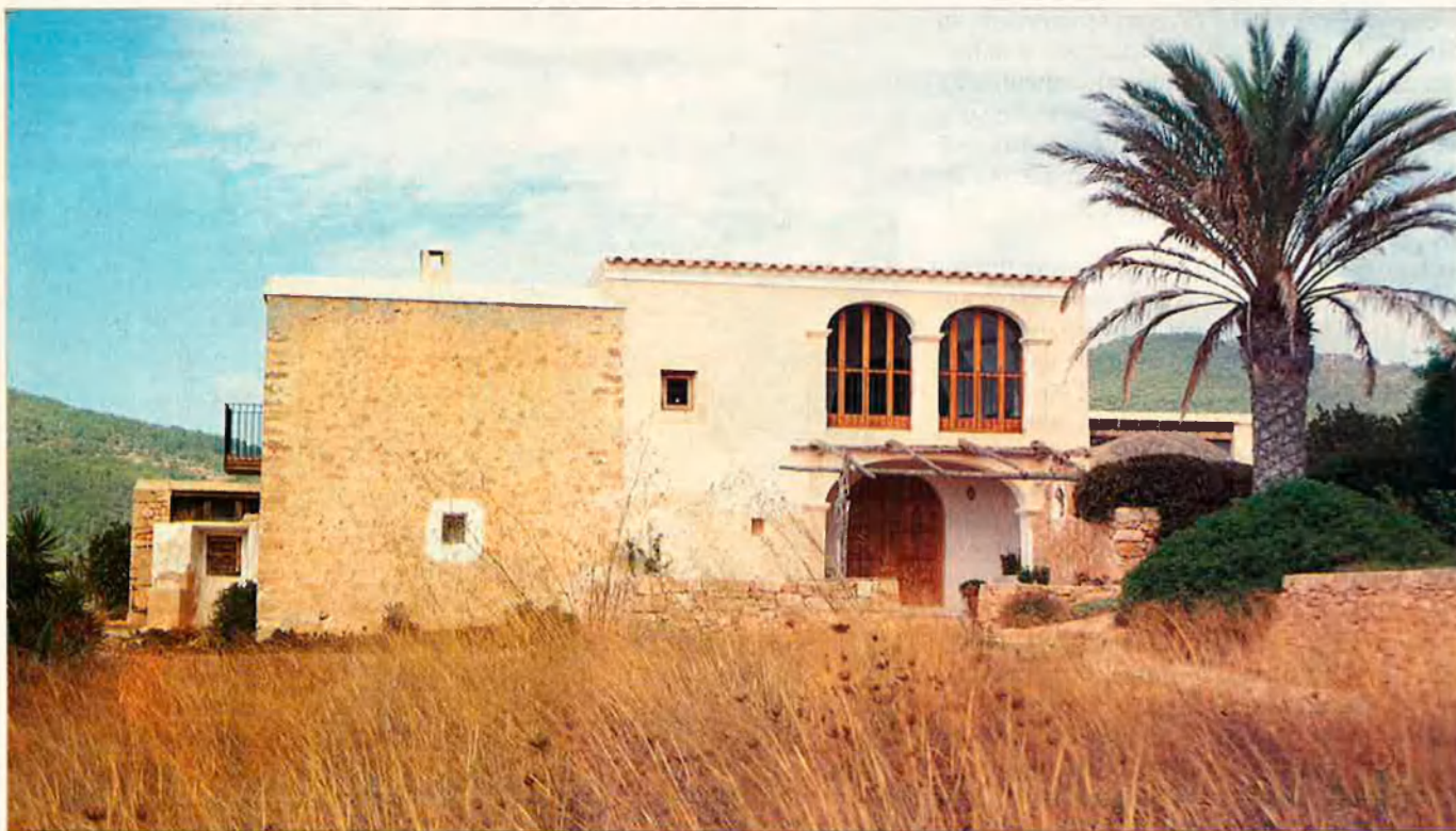
Una de les cases de Rotthier. Segons ell, cada lloc ha de tenir una arquitectura pròpia.