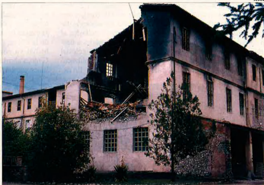
Can Llanas, o Hilandera, SA, de Manlleu. Futura depuradora.