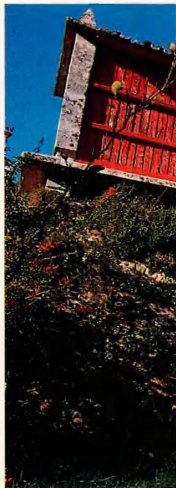
"Els socialistes parlen entre ells d'Horitzó 97. Vol dir que Fraga governarà fins que es jubile i que aleshores ells intentaran amb totes les seues forces l'assalt al poder".

—El PSOE pensa: ja n'hi ha prou, ens estem cremant. Millor que governe Fraga. I per això li faciliten tant que guanye les eleccions. La segona part de l'operació és el que els socialistes anomenen quan parlen entre ells Horitzó 97. Vol dir que Fraga governarà fins que es jubile, al 97, i aleshores ells intentaran