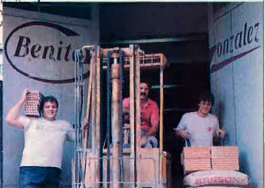
Bigas Luna veu cada dia la pastisseria d'en Foix i l'empresa de Benito Gonzalez (foto de la dreta). Això l'ha fet reflexionar.

és un nen de la Meseta. Jo sóc una persona dels setanta, generacionalment, en canvi ell és dels 80. Però en definitiva jo crec que les diferències són més ètniques, i és clar, d'estil, culturals... Però inevitablement tots expliquem el mateix. En el fons expliques el que veus. Però, en el fons, El cochecito , El pisito , Huevos de Oro o Jamón , jamón és el mateix. Es diferencia l'estil, la manera de fer-ho,