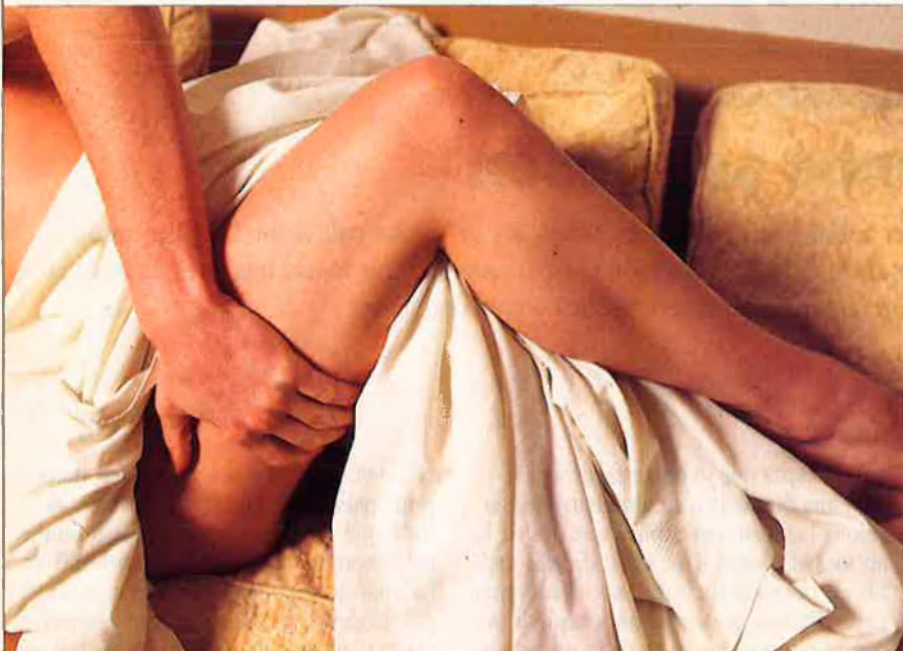
Una de les crítiques que rep el preservatiu femení és la incomoditat que suposa a l'inici d'una relació sexual.