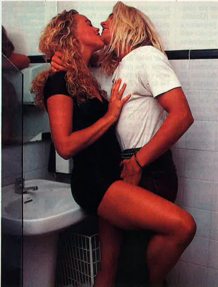
Alguns ginecòlegs creuen que és més normal que sigui l'home qui es posi el preservatiu.