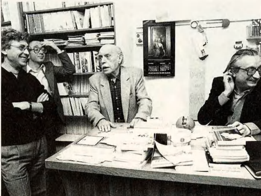
Raimon a 3 i 4. Una imatge familiar.