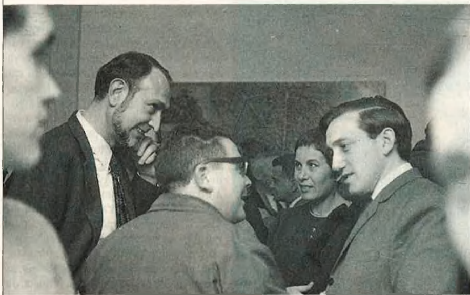
El distret Castellat, el sanguini Tàrrega i l'introvertit Cahner inauguren 3 i 4.

sobre la mateixa idea motriu –tenaç d'omplir els buits fonamentals d'una cultura amb voluntat normalitzadora: "No existia en narrativa cap Estellés ni cap Fuster, ni recordàvem res de bo des de Tirant lo Blanc". Calia cercar-los sota totes les pedres i van trobar-hi Amadeu Fabregat. El primer guardonat d'una collita, àmplia i dispersa, que, des de Cremades i Arlandis a Toni Cucarella, ha convertit l'escriptor valencià en una presència habitual al circuit barceloní.