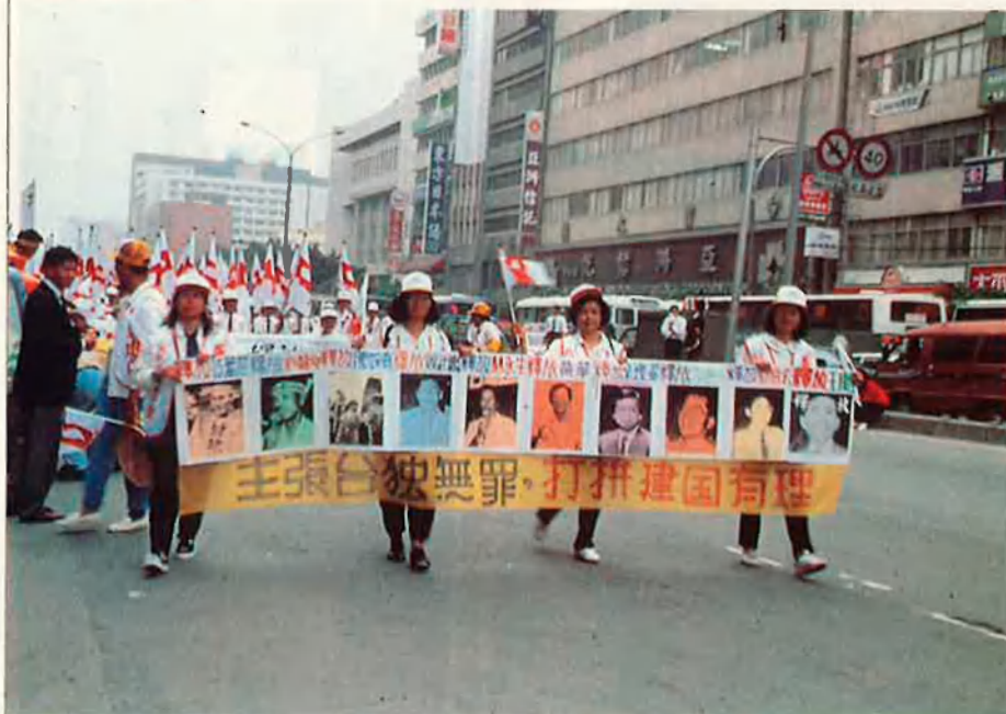
Taiwan viu ara un procés de transició cap a la democràcia.

En l'àmbit polític, el govern de Taiwan ha obert les portes a unes converses amb el govern de Pequín. El 27 d'abril denguany aquests tempteigs diplomàtics es concretaven en un encontre a Singapur de dirigents xinesos i taiwanesos. L'encontre va tenir una cobertura informativa sense precedents, tant al continent com a Taiwan, i el van protagonitzar dos interlocutors d'alt nivell. En les converses no es va plantejar ni en broma la qüestió de