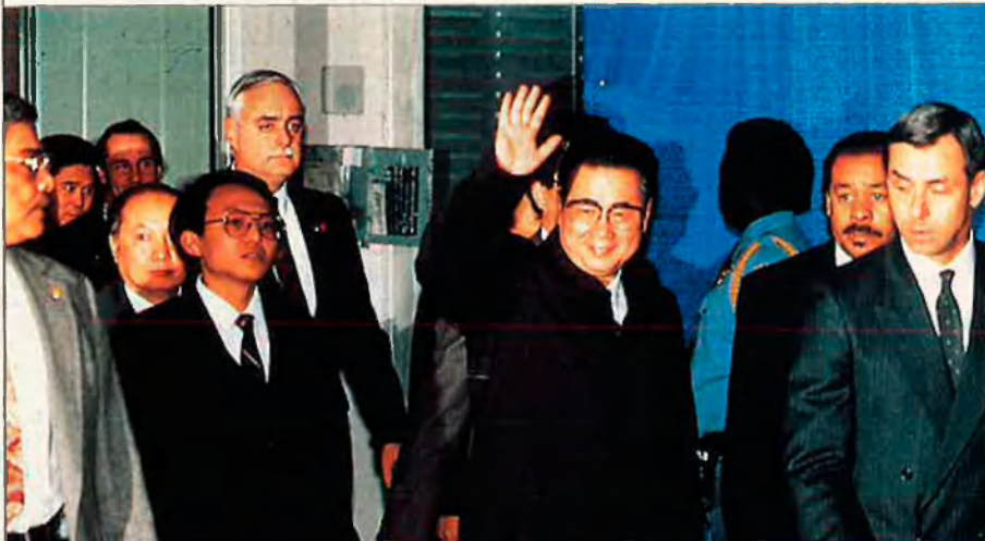
El primer ministre Li Peng podria desaparèixer de l'escena política.