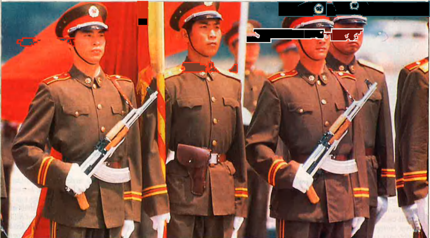
La Xina del 2000 pot esdevenir una potència militar de primera fila, tot i que la principal preocupació dels dirigents xinesos actuals és mantenir la integritat territorial i l'ordre públic.