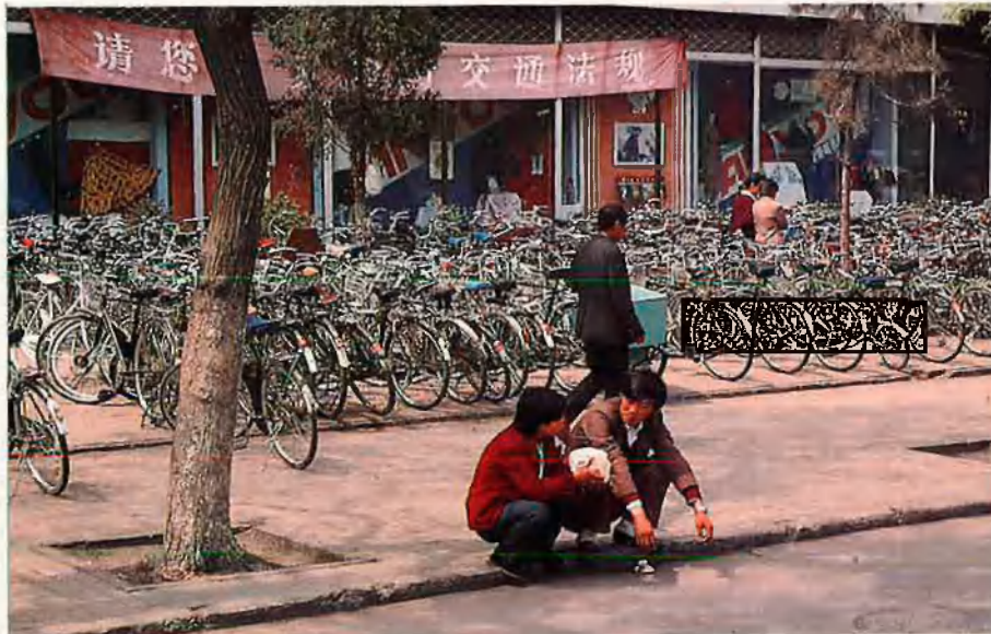
Els cotxes de luxe contrasten amb els milers de bicicletes, únic transport a l'abast de tothom.

xinesa ha entrat en una espiral accelerada que ha desbordat tota previsió. Tot va començar amb una certa timidesa amb la privatització del camp (900 milions de pagesos) i la liberalització del comerç. Però el procés es va disparar quan la mà d'obra barata i les facilitats de tota mena van atraure uns inversors estrangers que en realitat no són tan estrangers: deixant de banda la presència nord-americana —interessada a fer de la Xina un contrapès del Japó— i la més anecdòtica aportació europea, el gruix de la inversió s'ha nodrit dels més de cinquanta milions de xi-