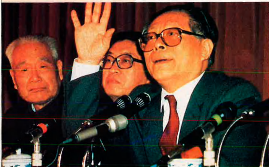
Jiang Zemin podria ser el nou home fort de la Xina, en lluita amb Zhu Rongji.

Zhu Rongji s'enfronta ara al repte de desaccelerar el creixement econòmic per tal de controlar la inflació. L'aplicació dels plans de retallades de projectes i d'inversions es convertiran en un test sobre el grau de control que exerceix sobre les províncies costaneres del sud. Hi ha qui fa dependre el seu futur polític