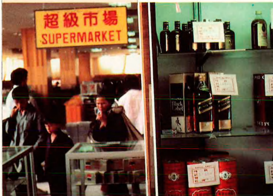
L'adaptació de la Xina a l'economia de mercat crea grans desigualtats entre territoris.

Però el govern de Pequín no vol ni sentir parlar d'independència, ni de reconeixement diplomàtic del que ells consideren