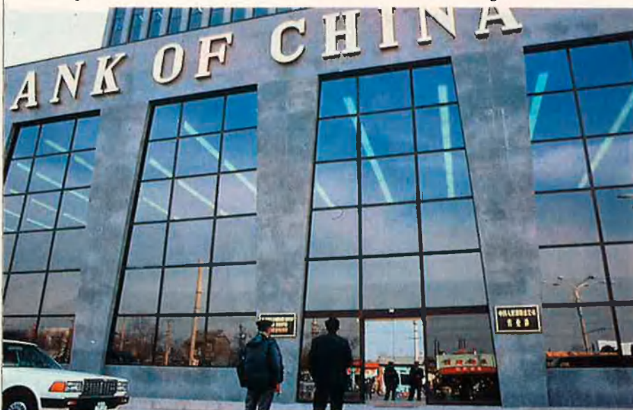
En les ciutats de règim econòmic especial, els negocis es fan ja amb dòlars i no pas amb yuans.

A la Xina d'avui dia, de qualsevol cosa, se'n poden treure diners. Entre els negocis més sorprenents que han sorgit hi ha el dels cementiris de luxe per a xinesos d'ultramar que volen reposar eternament en terra xinesa, oferta al mòdic preu de 500 dòlars el metre quadrat. L'avidesa no té aturador: el viatger no s'ha de sorprendre si, en sortir de l'hotel amb el mapa de la ciutat sota el braç i després d'haver demanat ajut per trobar una adreça o la manera d'arribar a un monument, l'amable ciutadà que l'ha orientat li demana diners a canvi del servei prestat.