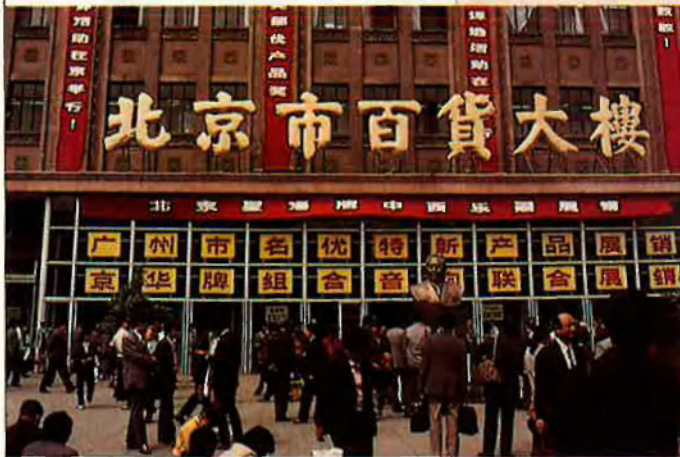
L'escriptura continua sent un dels pilars de la cohesió cultural xinesa. J. VILA

tes del PDP s'oposen a la doctrina tradicional del Kuomintang, partit en el poder a Taiwan des del 1949, que té per objectiu prioritari la reunificació amb el continent.