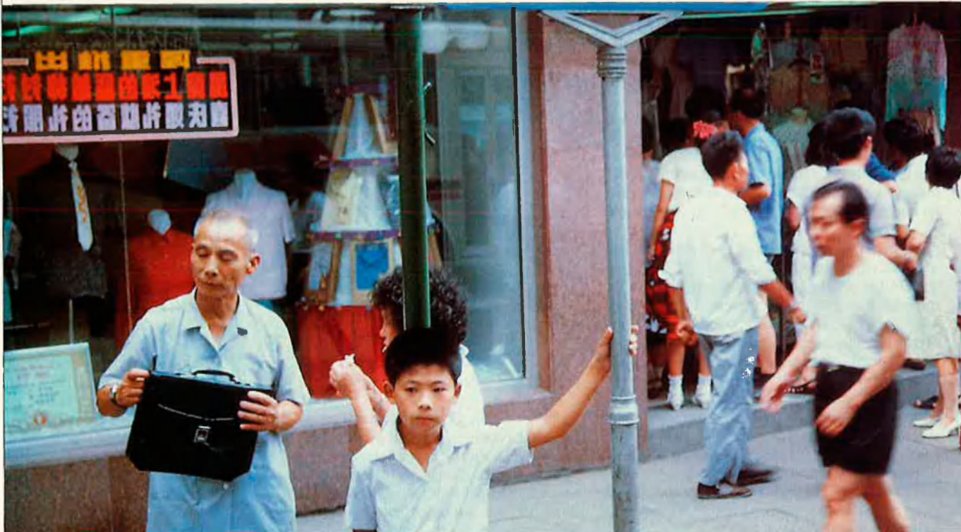
Xangai és una de les ciutats xineses que més s'ha decantat per la transformació capitalista.