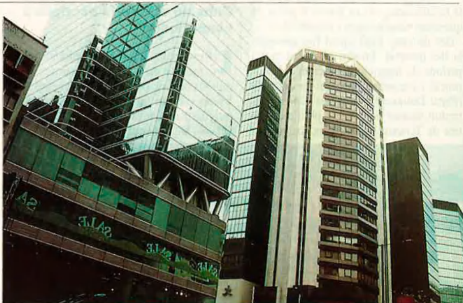
Les autoritats xineses temen que Hong Kong tingui massa influència sobre els territoris veïns, un cop deixi de ser colònia britànica el 1997.

D'ençà que en 1949 Chiang Kaishek i els seus seguidors del Kuomintang, derrotats per Mao Zedong, es van refugiar a l'illa de Taiwan i hi van establir la República Xinesa -hereva i continuadora de la