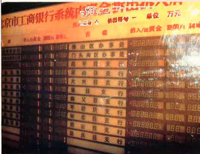
La Borsa de Xangai és un dels temples dels nous yuppies xinesos.

A banda la incertesa que genera la successió dels dirigents, hi ha altres interrogants en el futur immediat de la Xina. La venda de míssils al Pakistan, l'afer del vaixell que presumptament transportava armes químiques i l'expulsió, aquest agost proppassat, del dissident Han Dongfang —que durant la revolta democràtica del 1989 va promoure la creació d'un sindicat independent—, han augmentat la tensió diplomàtica amb les cancelleries occidentals en un moment en què els xinesos semblaven molt interessats a aconseguir l'organització dels Jocs Olímpics