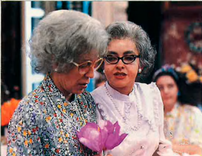
La Cubana desfilirà pel carrer de les Barques, al Teatre Principal de València, amb el seu nou espectacle.