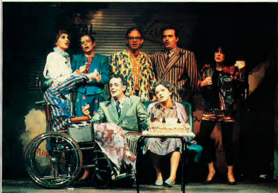
Dagoll Dagom presentarà el seu darrer muntatge Historietes .