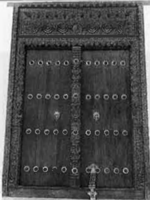
Porta d'estil Omani. CORRI PEDROLA

Les portes Gujerati es caracteritzen per la utilització de portalada amb bigues que connecten l'exterior amb l'interior. Són les més amples de tota la Costa Est d'Àfrica i foren posseïdes per mercaders khoja i bohra (provinents de Cutch, la majoria). El dibuix de les llindes (repetit sobre l'estret post central) sol constar d'un trenat florejat sembrat amb roses (a cops, tenen una placa ovalada al centre de la llinda amb el nom del propietari). Els exemples més bo-