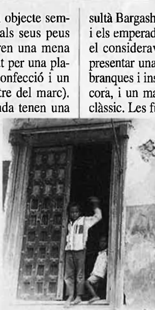
Porta d'estil Gujerati. CORRI PEDROLA