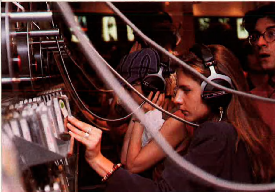
Comença la liberalització d'horaris. C. PUÉRTOLAS

per a nosaltres era molt clar que la primera llengua era el català, que hi ha una altra llengua que és el castellà, i que hi ha una tercera llengua, que és l'anglès", comenta Urbano. Segons el director general, això és degut al fet que Virgin té una particularitat que no tenen les altres multinacionals: que s'adapta a l'àmbit on s'instal·la.