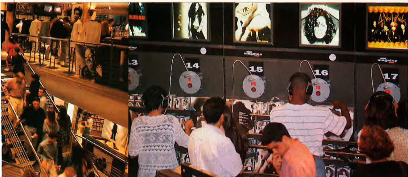
L'afluència de clients el passat diumenge 19 de setembre va ser nombrosa i ben rebuda per la direcció de la multinacional Virgin.