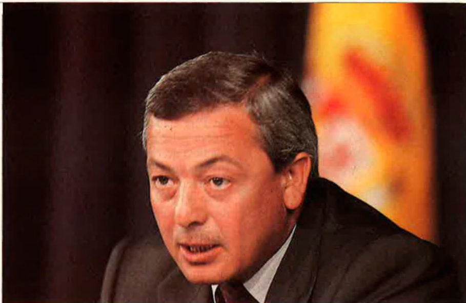
L'ex-ministre Carlos Solchaga continua influint molt des del seu nou càrrec de portaveu parlamentari socialista.

Tothom que palpés la glòria del capital familiar, sense més límits que la voluntat de mantenir el patrimoni, seria benvingut a l'Institut de l'Empresa Familiar, el nom que descobria les activitats semiclandestines d'un grup de burgesos que, almenys des del maig de 1991, es reunien en tertúlies informals per queixar-se de la voracitat d'un govern en permanent cacera fiscal i traspasar-se informació sobre l'evolució del terrorisme a Catalunya per si de cas a ells els tocava rebre. La idea que les seves empreses no eren com les altres –ni la botiga del PI-MEC ni els consellers delegats de la CEOE–, quallava. Era creïble. Malgrat l'atomització i l'apatia col·lectiva de la bur-