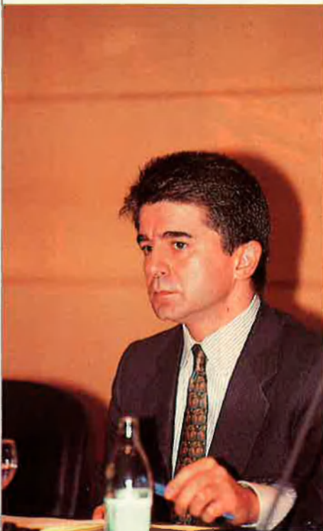
Antoni Zabalza, secretari d'Estat d'Hisenda

Aquestes setanta empreses, assentades als anys noranta, ja havien superat l' horror vacui però no volien enfonsar-s'hi de nou per culpa, o gairebé, de la fiscalitat mortuòria. Buscaven, doncs l'interlocutor que els garantís la protecció de l'Es-