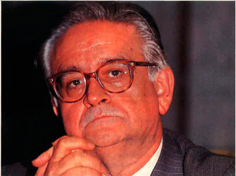
Luis Ángel Rojo, actual governador del Banc d'Espanya, ha creat tota una escola d'economistes.

De Boyer fins a Solchaga, hi ha tota una generació compacta que ha cregut en aquest subtil instrument del paper moneda: tensant el crèdit intern, removent l'oferta monetària i actuant sobre el tipus d'interès va delimitar -enquadrar, tipificar i, tot sovint, pifiar tots els terrenys de la vida econòmica des del prés-