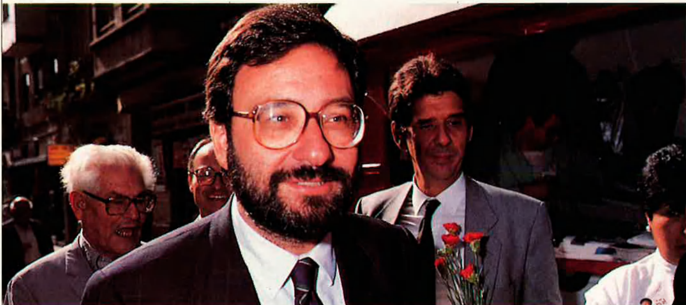
Les eleccions del 6 de juny han convertit Narcís Serra en vice-president efectiu d'un govern que té com a prioritat màxima encarrillar una depressió econòmica inusual, seriosa com pocs s'imaginaven.

El Ministeri d'Economia, la vice-presidència econòmica, el portaveu economista... Una dècada de rigor monetari obre pas a una divergència d'interessos que influirà, decisivament, en l'articulació de la política econòmica dels noranta.