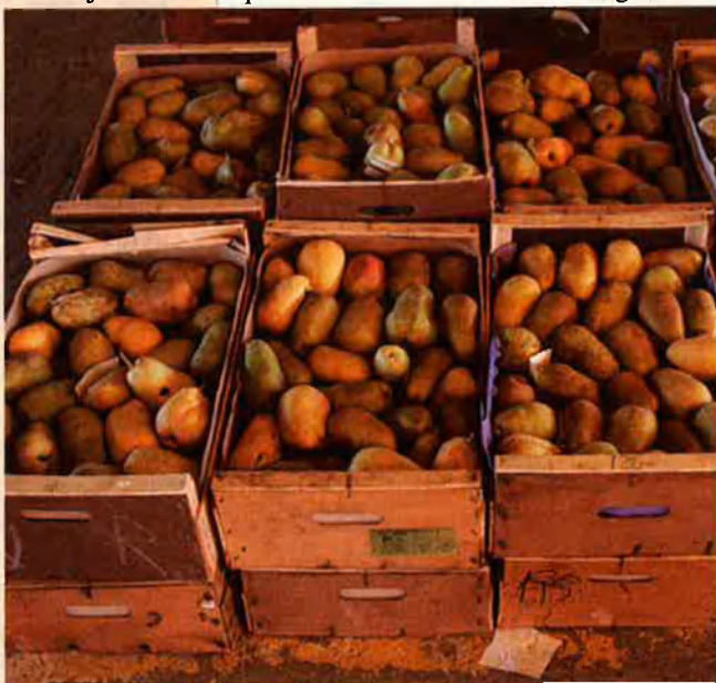
La pera llimonera, tot un símbol de les terres de ponent.