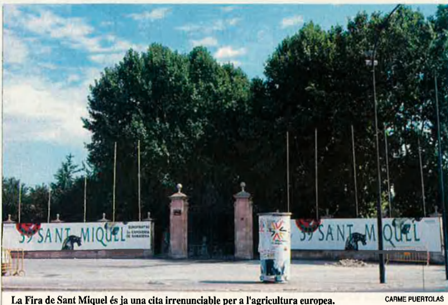
La Fira de Sant Miquel és ja una cita irrenunciable per a l'agricultura europea.

Curiosament, per Sant Miquel, tot el moviment que genera la Fira, “qui més