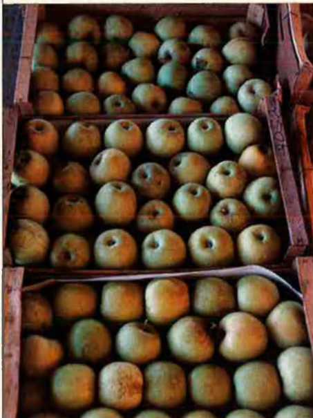
La golden és, sens dubte, la reina de les pomes.

Un equip de tècnics txecs s'han interessat també per participar en la fira d'enguany, però el tècnic de la Cambra de Comerç no hi confia gaire, perquè són grans productors de cítrics i hortalisses i tenen un bon mercat més a prop de casa, Alemanya i algun altre país de l'Est d'Europa.