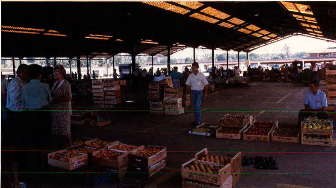
Durant cinc dies, a la Fira de Sant Miquel es tancaran milers de tractes al voltant de la fruita.

La pagesia pateix. Ho diuen els diaris i algun documental. I és cert. Fa massa temps que pateixen. Quan no és la superproducció que surt de l'infern, és una pedregada que cau directament del cel. Amb el clima, no hi manera d'entendre's-hi. No s'hi juga. Però els pagesos estan per la collita i la setmana que ve s'atansaran a la "seva" Fira, una de les manifestacions firenques agrícoles i ramaderes més importants de la península. I ni que sigui d'una manera lúdica, aniran per feina, de bracet de la dona i sense adonar-se de com s'emmusteix l'herba dels Camps Elisis que l'alcalde Fuster va voler fer a imatge i semblança dels Champs