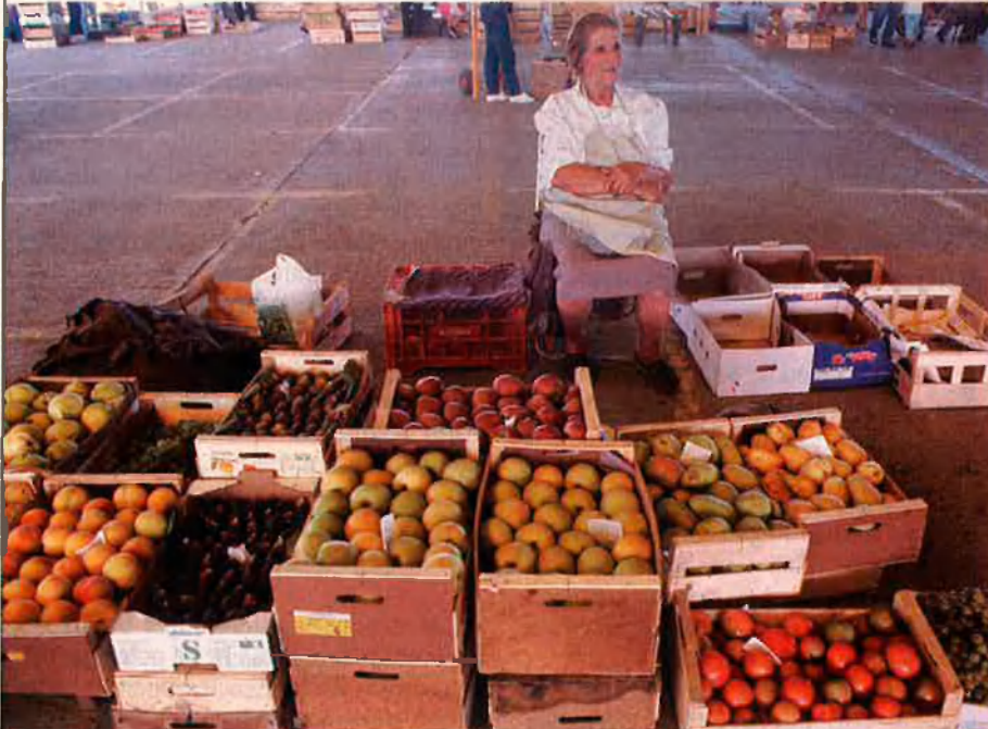
L'exhibició de productes és, per ella mateixa, motiu sobrat per a justificar una visita.