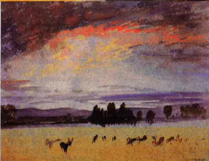
Cérvoles al parc de Petworth, 1827. ARXIU Estudi preliminar d'una de les obres que Lord Egremont va encarregar a Turner.

A banda encàrrecs, Turner realitzà projectes propis, com la sèrie de cent dibuixos gravats titulada "Liber Studiorum", a la manera del "Liber Veritatis" que havia confeccionat temps abans el pintor francès Caude Lorrain, un dels artistes que més va influir Turner. El "Liber Studiorum" tenia l'afany de presentar davant el públic tota