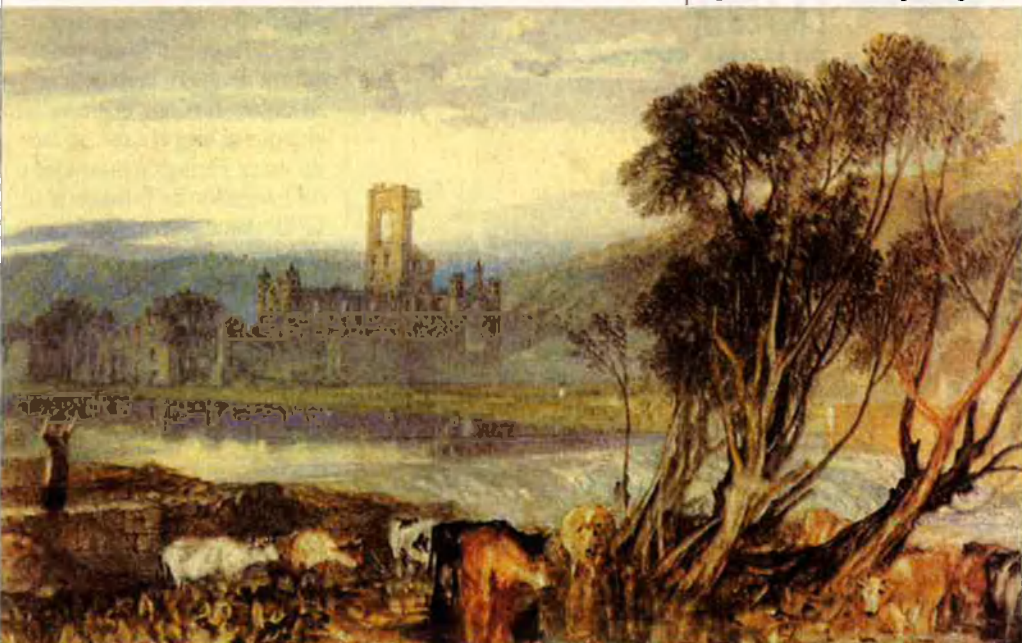
L'Abadia de Kirkstall, sobre el riu Aire, 1824. ARXIU Una de les aquarel·les que formen la sèrie "Els Rius d'Anglaterra".

Turner va aconseguir de dignificar el gènere aquarel·lístic, considerat menor en la seva època, i la temàtica paisatgista,