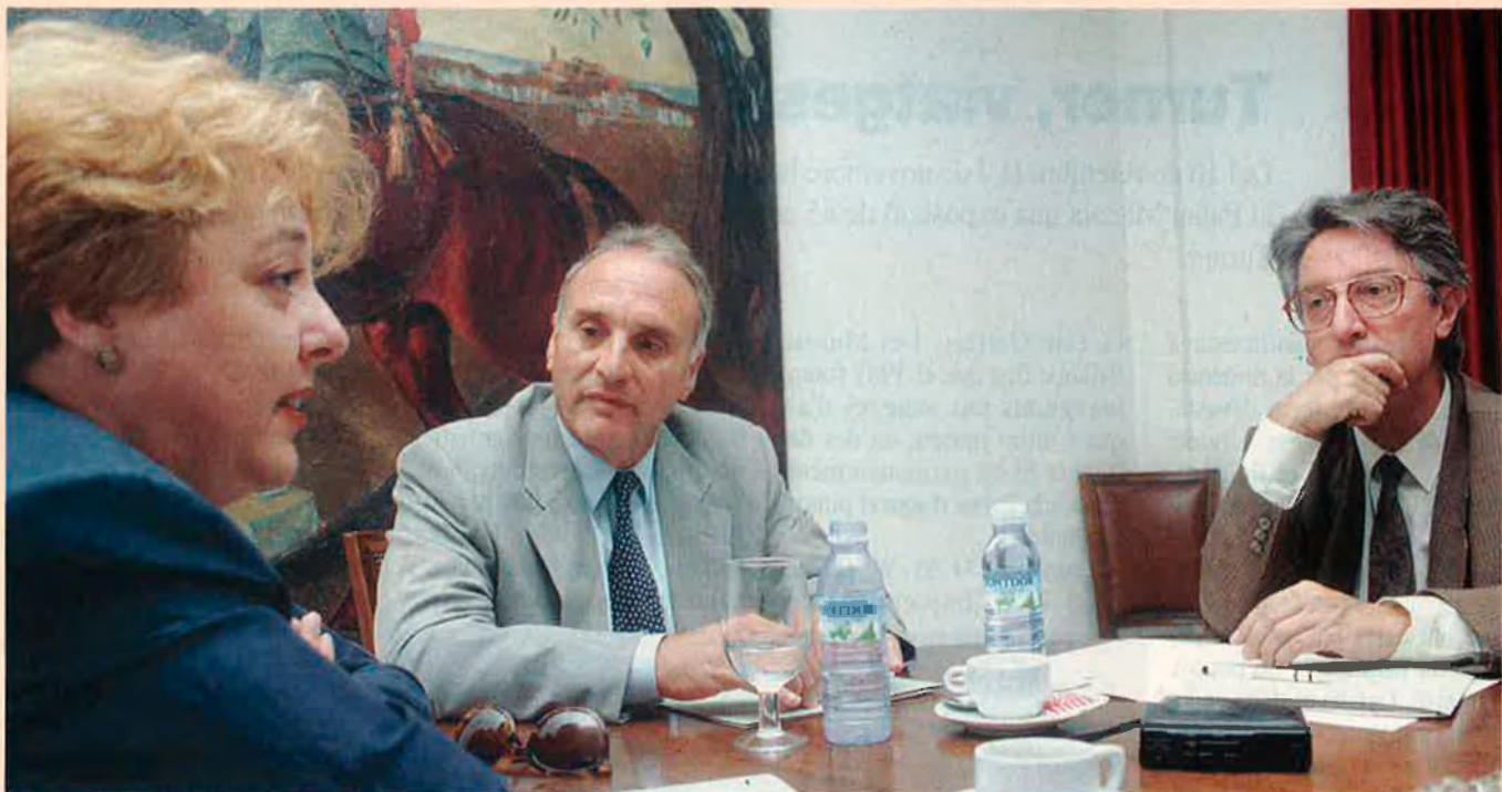
Una entrevista insòlita. Els tres consellers de Cultura dels Països Catalans parlant, per a EL TEMPS, en una mateixa taula.