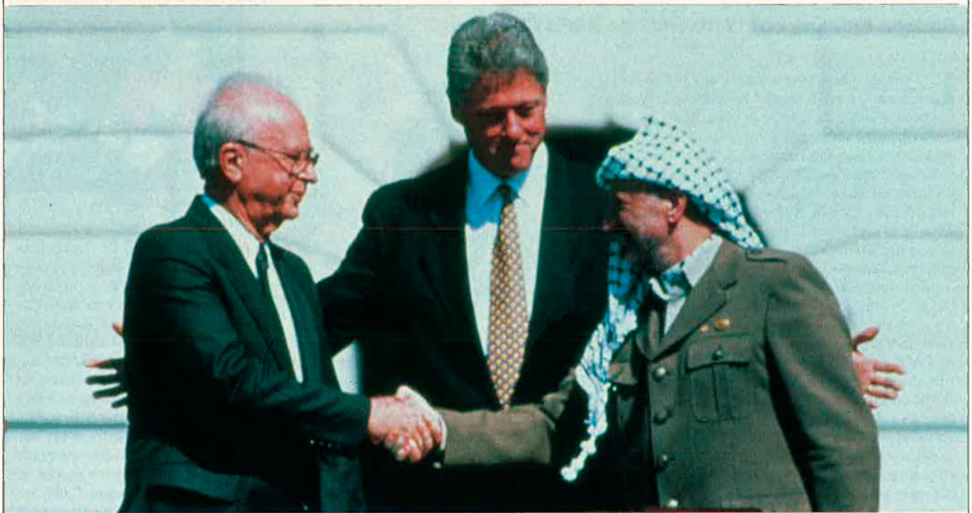
Rabin, Clinton i Arafat, principals protagonistes d'un acord històric.